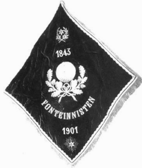
Vlag van de Fonteinsteinen (1843-1901) Borduurwerk van zilverdraad op rood fluweel. Het betreft een boldersmaatschappij (platte bol). Lokaal was gevestigd in de Nieuwstraat te Sint-Niklaas (Herberg De Fonteyne) (Verzamelingen Kon. Oudh. Kring van het Land van Waas).

De vlag van de Fonteinsteinen is een knap borduurwerk van zilverdraad op rood fluweel. De uitdrukking 'het vos' of de put vermeldt een maatschappij met een platte bol. Het lokaal was gevestigd in de Herberg 'De Fonteyne' in de Nieuw- straat. (Vlag behoort tot de verzamelingen van de Koninklij- ke Oudheidkundige Kring van het Land van Waas)