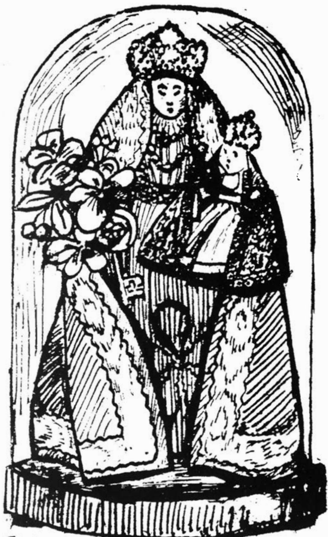
TENTOONSTELLING van O.L.VROUW KAPELLEKEN'S - Sept 1936.

In het september-november-nummer van 1936 publiceerde De Brabantsche Folklore volgend bericht: "Te Antwerpen werd in September 11., in de vroegere Sint-Niklaaskapel, door den Sanctjeskring een uiterst belangwekkende tentoonstelling ingericht. Ongeveer 200 huiskapelletjes werden er verzameld, echte folkloristische kunstwerkjes, ontroerend naïef" 154 .