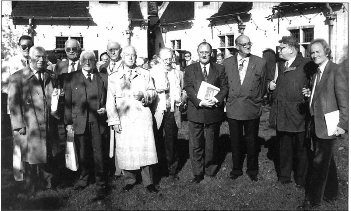
Groepsfoto tijdens de receptie.