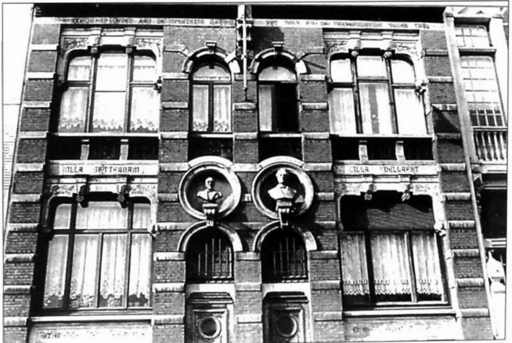
De vensterpartijen van Villa Zetterman en Villa Snellaert, met de portretbustes. Boven en onder de vensters zijn de bijhorende opschriften aangebracht.