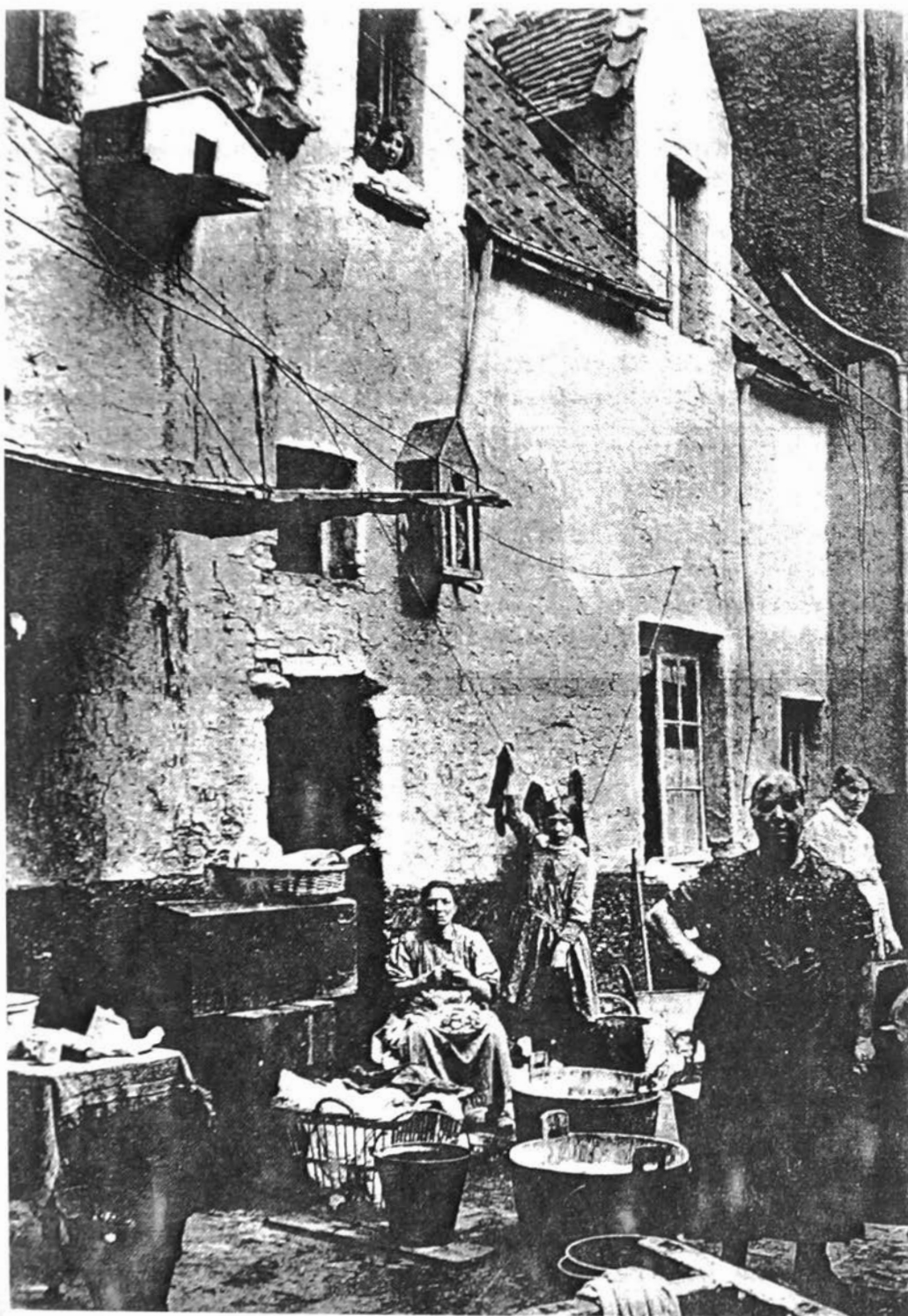
Het armoedige bestaan in het Schipperskwartier (Klokkengang/Blauwbroekstraat) ca. 1900 waar men uitkeek naar het vieren van carnaval, uit: K. NIEUWENHUIZEN. Antwerpen gefotografeerd in de 19de eeuw, Amsterdam/Antwerpen, 1976, p. 59, foto 66.