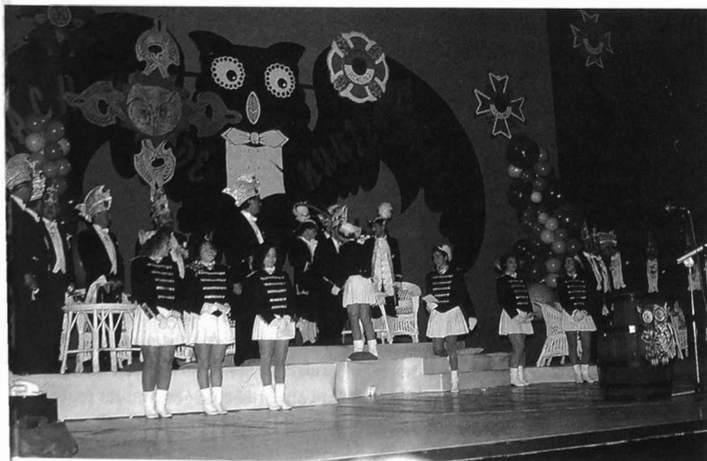
De damesgarde van D'n Uul tijdens de uitverkiezing van de nieuwe Prins. (1990)