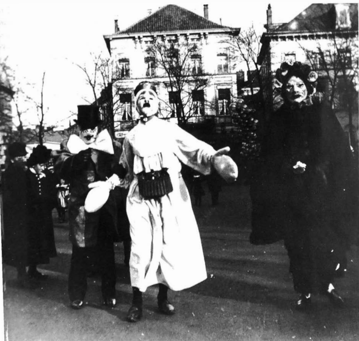
Carnaval. Gemaskerden op de Kouter in Gent.

In de zondagskrant van 1895 ging de Journal de Gand dieper in op het fenomeen van de 'kompagnies'. " Il est un grand nombre de nos citoyen/nes qui honorent carnaval d'un culte ardente. "