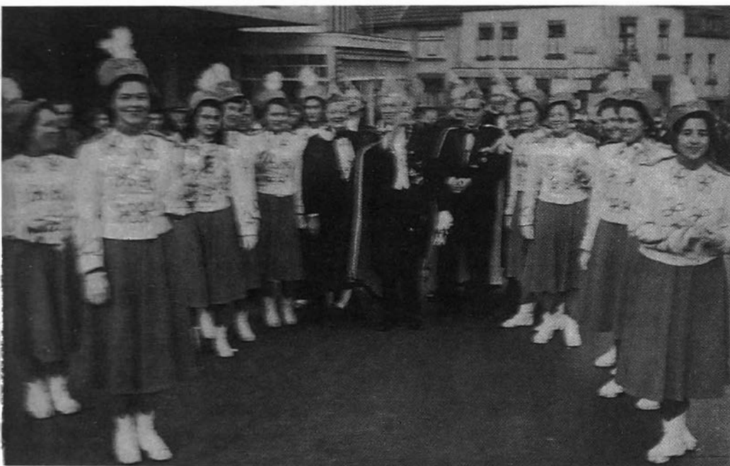
D'n Uul met een van de eerste damesgardes op bezoek in Valkenburg.