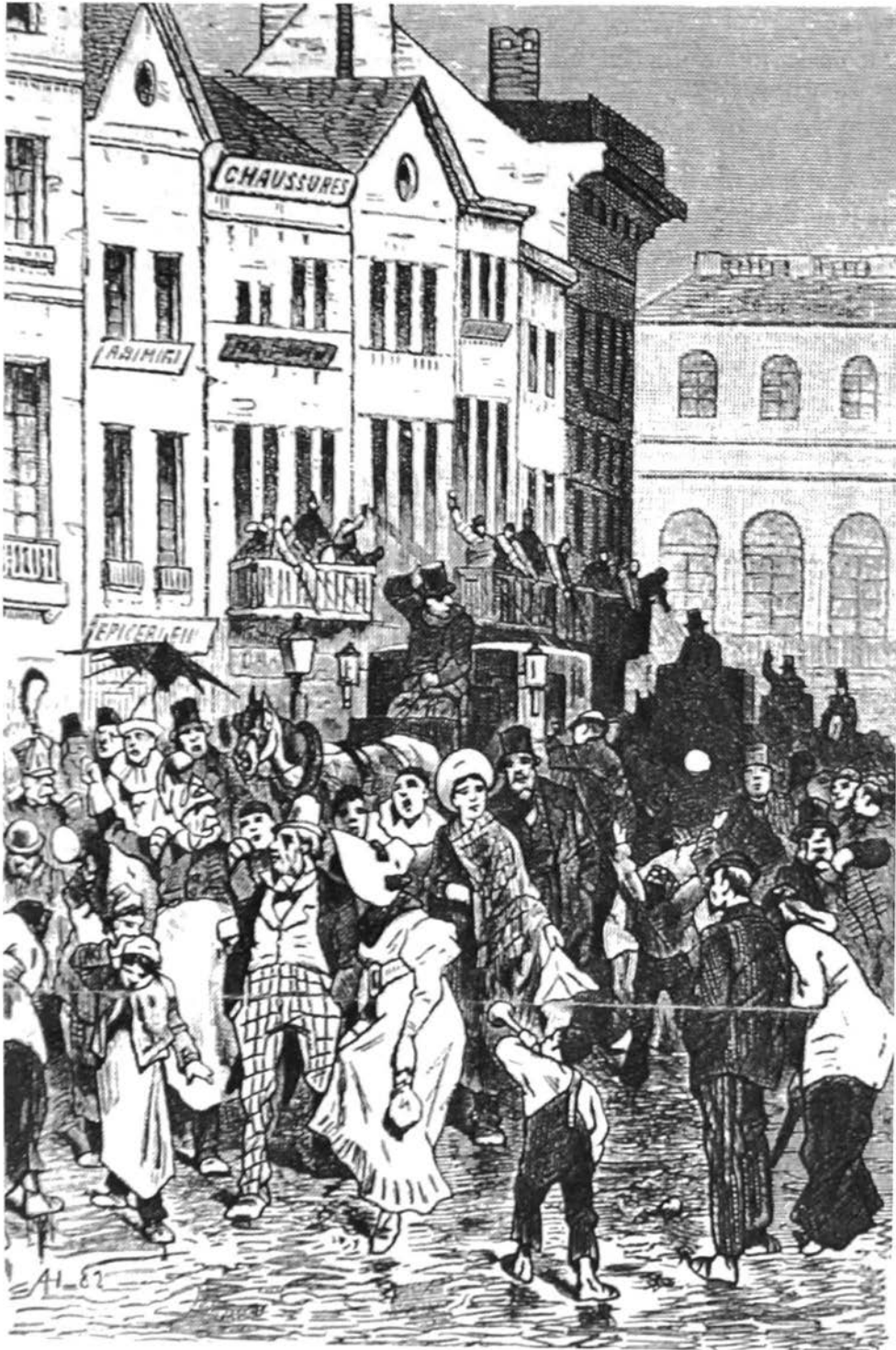
Carnaval op straat met het werpen van pepernoten, uit: C. LEMONNIER. Antwerpen en zijn merkwaardigheden. Haarlem, 1885, p. 33;