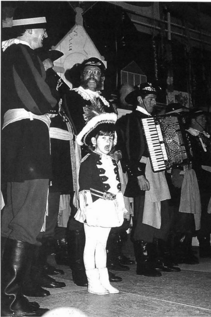
Een dansmarietje, een jong en onschuldig huppelpupke. Achter haar staan enkele leden van het Gilde van de Blauwe Schuit uit Heerlen. (Brunssum, 1989)

ten enkele organisatoren het plan op om een damesgarde te formeren. Vorst Lowie van de vereniging, een streng gelovig katholiek, vond dat vrouwen niet in de carnavalswereld thuis hoorden, en was dan ook niet geporteerd van