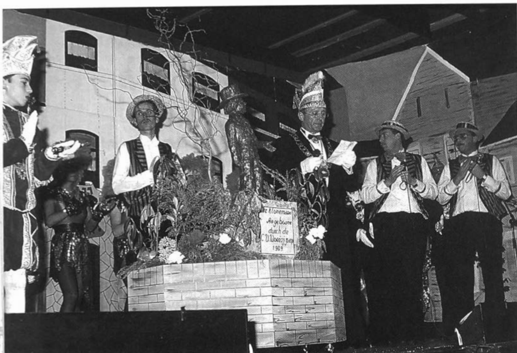
Tijdens de Jubileumrevue van de CV Woeësjoepe in Simpelveld stond een replica van het standbeeld d'r Kloneman op het podium. D'r Kloneman is uitgegroeid tot het symbool van de lokale carnavalsviering in Simpelveld. (1993)

wordt op elf november, de start van het carnavalsseizoen, Bacchus weer uit de Roer gehaald en tot leven geroepen.