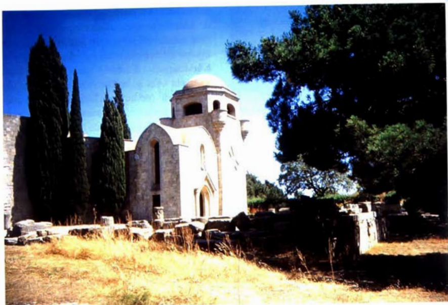
Italiaanse cipressen op johannieterkerkhof. Rhodes (Griekenland).

Vanaf dat ogenblik werd de cipres het symbool van rouw en ontroostbare smart.