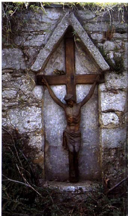
Palmtakje op kruisbeeld. Wêris.

Een week voor Pasen, op Palmzondag, herinnert de Kerk aan het bijbelse verhaal van de blijde intrede van Jezus in Jeruzalem, nederig