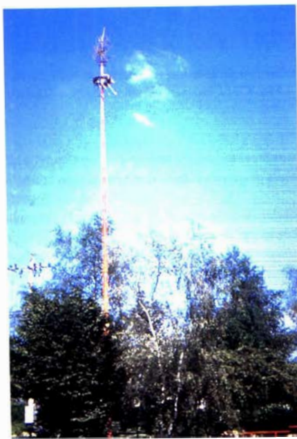
Mastboom. Robertville Dia Marcel De Cleene

Dennen en sparren worden in de volksmond ook "mastbomen" genoemd, omdat men er vroeger vaak "mastbomen" uit maakte: ontschorste meibomen die men in de periode van 1 mei tot Pinksteren (pinkstermei) opricht. Op de masten hing men een rad dat met groen versierd was, en/of behangen met allerlei geschenken of eetwaar. Meifeesten voorzagen o.a. ook in een mastklimming, waarbij het lekkers van het rad kon worden gehaald.