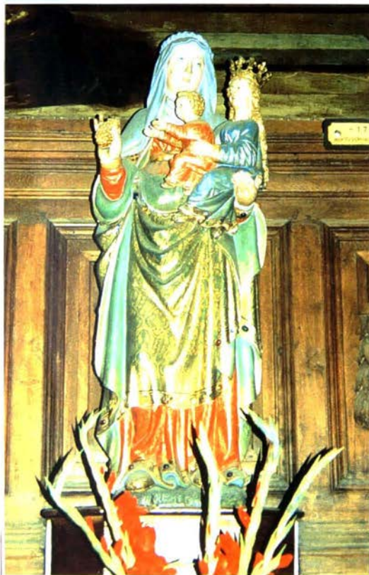
Dennenappel in de rechterhand van de H. Anna. O.L.V.-kerk van Aarschot.

Ooit ontschorste men dennen/sparren spiraalvormig, omdat men vreesde dat de heksen onder de sehors schuilden. Alvorens de meiboom op te richten, versierde men hem met kleurrijke slingers, omdat men dacht dat de levenskracht erin samengebaldd zat.