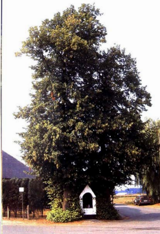
Kapelletjesboom. Eke.

de Germaanse mythologie speelt de linde ook haar rol. De linde werd vooral in het Noorden vereerd, waar hij vaak de plaats van de berk innam. De boom was gewijd aan Freya, de Germaanse godin van de liefde (misschien wel omwille van haar hartvormige bladeren?) en de vruchtbaarheid, of aan Holda, de Germaanse Moedergodin (in sprookjes bekend als 'Houwwrouw' en 'Vrouw Holle'), tevens godin van de dood en de wedergeboorte.