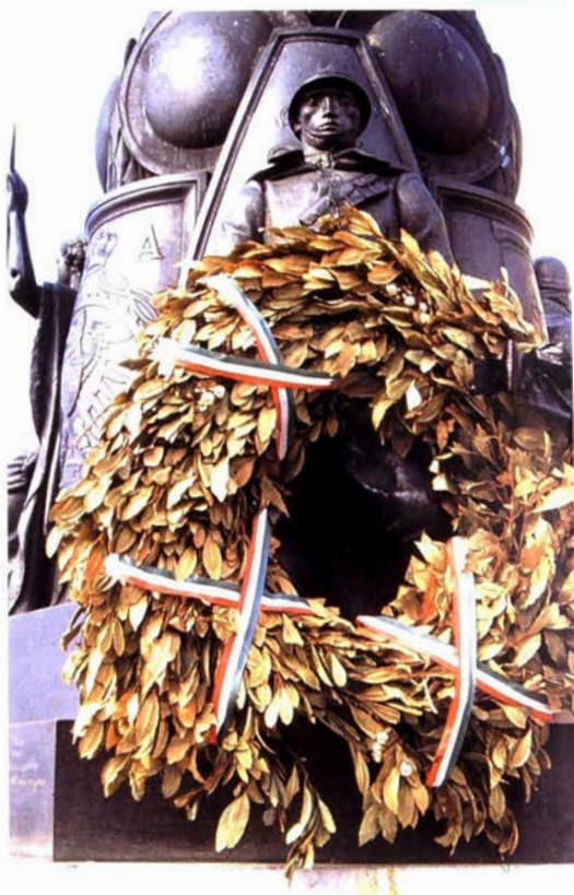
Oorlogsmonument met laurierkrans. Triëste (Italië). Dia: Marcel De Cleene

In de Oudheid schreef men de laurier een 'zuiverende' en heilzame kracht toe. De struik was gewijd aan Apollo, zonnegod en grote zuiveraar. De Griekse veldheren die zegevierend terugkeerden van het slagveld droegen een laurierkrans, omdat ze daardoor hoopten zich te zuiveren van hun bloedvergieten. Maar met de jaren verzwakte de oorspronkelijke bedoeling en werd de laurierkrans gelcidelijk aan een symbool van militaire overwinning, overwinning in het algemeen, verering en onderscheiding. Ook de Romeinse keizers en bevolking namen de laurier als symbool van de overwinning over. Omdat na een zege een vredesperiode volgt, werd de laurierkrans (naast de palmtak) ook