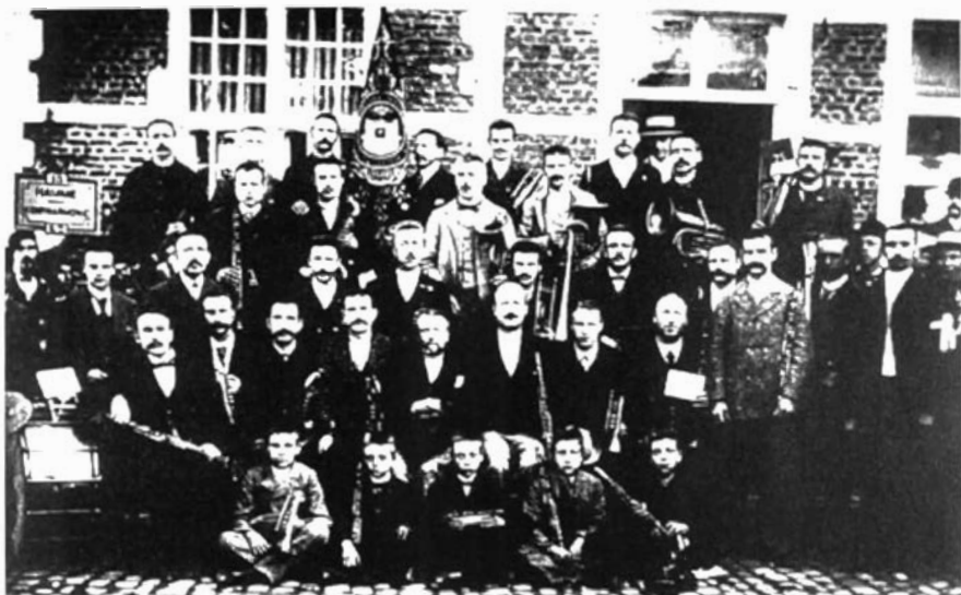
De Koninklijke Harmonie St.-Cecilio van Hamme, gesticht in 1777.

amateuristische muziekverenigingen betekenen. Het is duidelijk dat deze laatste heropleving te danken was aan de overwinningssfeer. Ook al was iedereen, zelfs de overwinnaars, zwaar gehavend uit de oorlog gekomen, toch was er na vier lange jaren terug plaats voor plezier. De verenigingen die onder deze noemer vallen, zijn dikwijls ook te herkennen aan hun benaming die een eerder pacifistische bijklank heeft, bijvoorbeeld "De Toekomst" uit Olen, opgericht in december 1918.