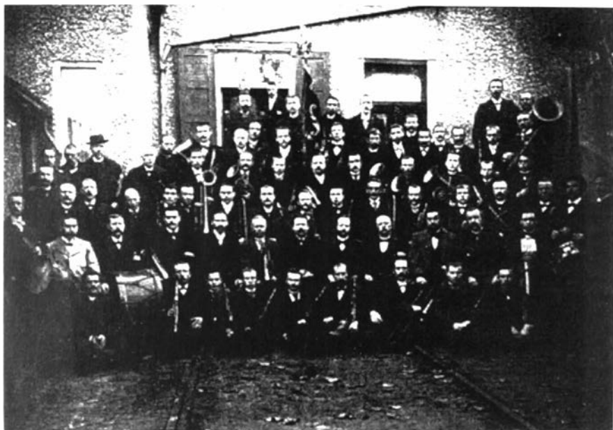
Harmonie "Concordia et Amicitia" uit Bornem voor hun repetitielokaal in café "De Roos".

en onverschilligheid. Dit kan te maken hebben met de langzame verspreiding van nieuwe ontspanningsmogelijkheden, zoals sportverenigingen.