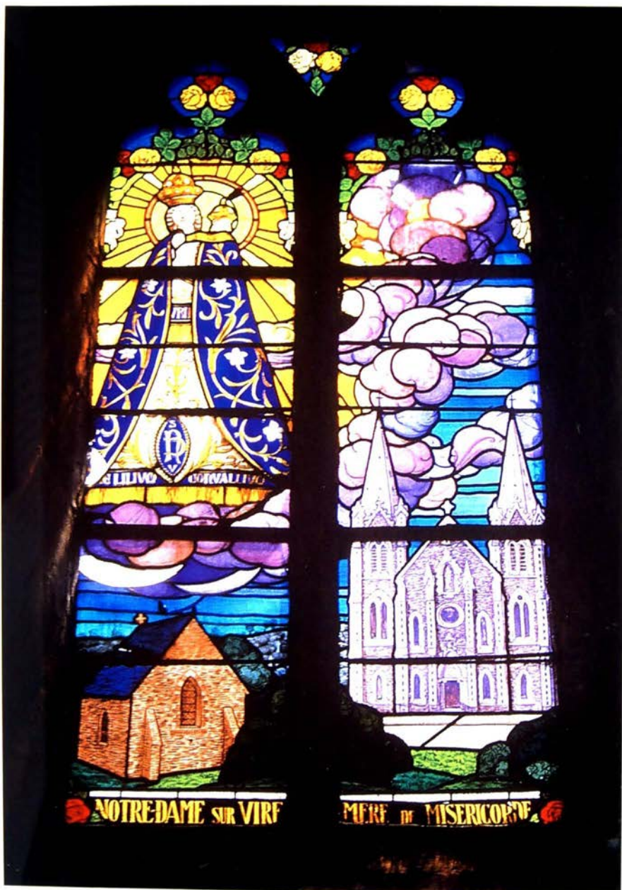
Glasraam ter ere van de Notre-Dame-de-Vire, versierd met goudgele, witte en rode rozen. Abdij Notre-Dame-sur-Vire, Saint-Sauveur-le-Vicomte (Frankrijk).