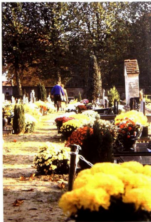
Chrysanten op een kerkhof, op Allerheiligen. Campo Sancta, Sint-Amandsberg.

Op 1 november, ooit het Keltische Zielenfeest (Samhain), nu het feest van Allerheiligen voor de Rooms-Katholieke Kerk, plaatst men chrysanten op en rond de graven.