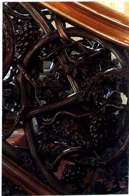
Wijnstok met druivenranken als trapleuning van een barokke preekstoel.

De roos bekleedt een voornamelijk plaats in de klassieke mythologie. Over het ontstaan en de kleur van die goddelijke bloem bestaat er een waaier van mythen. Volgens de ene zou de roos geboren zijn uit het schuim van de zee en was zij oorspronkelijk wit; ze werd echter rood, nadat de Griekse liefdesgod Eros wat nectar op de bloem liet vallen. De roos is een ouderud symbool van liefde en vreugde, dat bovendien hoogste schoonheid, harmonie en perfectie uitdrukt. Rode rozen symboliseren warme, lichamelijke liefde, bekoorlijkheid en gelukzaligheid; witte rozen zuivere, geestelijke liefde. De betekenis van gelukzaligheid komt goed tot uiting in uitdrukkingen als "Over rozen gaan", "Op rozen zitten" en "Slapen als een roos." Een Griekse mythe heeft het over Eros die de bemoeizieke Harpocrates de eerste roos gaf, opdat hij