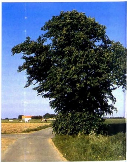
Sint-Hilariuslinde of Tilea: een Oost-Vlaamse spookboom. Wannegem-Lede.

Toen in de middeleeuwen de figuur van Maria, de Moeder Gods, de rol van de lokale heidense moedergodinnen ging overnemen, werden tal van cultuslinden (gewijd aan Freya) gekerstend tot kapelletjesbomen. In Opper-Beieren zijn er veel Mariabedevaarders-oorden die naar een lindeboom genoemd zijn. Ook in Vlaanderen is dit het geval, o.m. in het Oost-Vlaamse Kalken (Berlindekapel). In de sagen zijn sommige linden de verzamelplaats van heksen. Het gaat hier misschien wel om bomen die in de heidense tijd werden vereerd en daarom na de kerstening als heksenboom werden bestempeld. In heel wat noordelijke landen, ook in Vlaanderen, kende men trouwens linden die als een heksen- of spookboom beschouwd werden. De 'tileal' of Sint-Hilariuslinde in het Oost-Vlaamse Wannegem-Lede is hiervan een mooi voorbeeld.