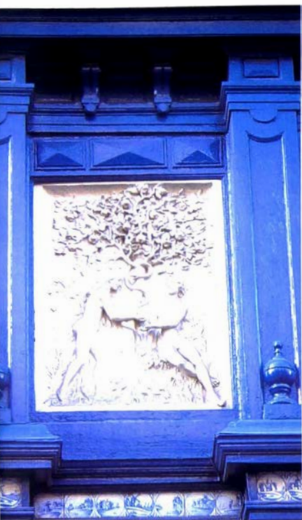
Bas-reliëf van de bijbelse Boom van de Kennis van Goed en Kwaad. Gent.

kon zeker geen appelaar bedoeld hebben, aangezien die boom niet in het Heilig Land gedijt. Eertijds, toen men aannam dat deze boom werkelijk heeft bestaan, wilden de theologen de boomsoort bepalen. Volgens sommige joodse schriftgeleerden was de boom niets anders dan een wijnstok, anderen hielden het bij een olijftak of een reuzentarewaaier; de Oude Grieken (en later ook de Grieks-Orthodoxe Kerk) hielden het bij een vijgenboom. Bij de Latijnse schrijvers spreekt men over een 'appel', vermoedelijk door een begripsverwarring rond het woord 'malum' dat niet alleen appel, maar ook 'het kwade' kan betekenen. In elk geval werd de