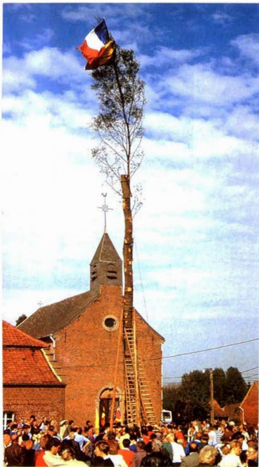
Een eik (met daarop een berk) als meiboom opgericht. Marcoult-Silly. Dia: Marcel De Cleene.

ting van de meiboom in het Henegouwse Saint-Marcoult (Silly) verloopt nog op de oorspronkelijke wijze.