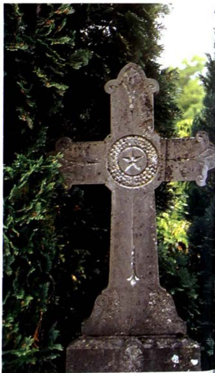
De schijn-cipres ( Chamaecyparis ) vervangt in de gematigde streken vaak de echte cipres als dodenplant. Marville, Frankrijk. Dia.

(Cupressus), Apollo's vriend, doodde op een dag per vergissing het tamme hert dat hij elke dag verzorgde. Hij had daar zoveel spijt van, dat hij zichzelf wou doden. Zelfs Apollo slaagde er niet in zijn vriend te troosten. Ten einde raad vroeg de zonnegod dan maar aan de andere goden dat ze eeuwig tranen zouden uitstorten over de aarde. Op slag veranderde Kyparissos in een boom (een 'cipres'), waarna Apollo bedroefd zei: "Ik zal je altijd blijven bewenen. En jij, je zult de anderen bewenen en je lot verbinden met hun smart."