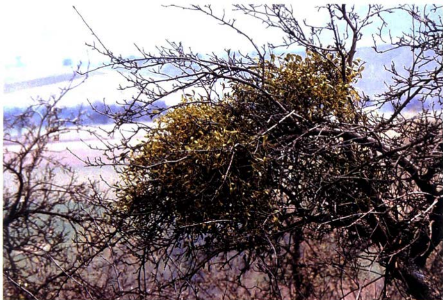
Maretak op Appelaar. La Hulpe.