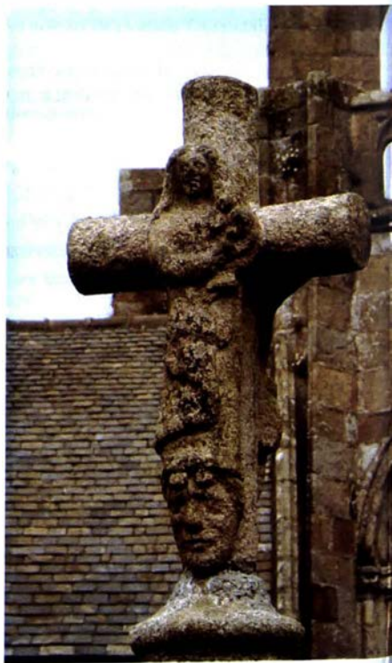
Stenen kruisbeeld met Maria en Kind, geplaatst op het hoofd van een heidense moedergodin. Tréguier (Bretagne, Frankrijk). Een mooi voorbeeld van kerstening van een heidens idool.

lichten of fakkels hadden geplaatst bij bomen, bronnen, rotsen of kruiswegen. Zendingen gingen uiteraard ook tegen die boomverering in. Bekende voorbeelden zijn o.m. Sint-Martinus van Tours (4de eeuw) die de heilige Den bij de Dianatempel nabij Tours liet omhakken, en Sint-Bonifatius van Mainz (ca. 674-754) die hetzelfde deed met