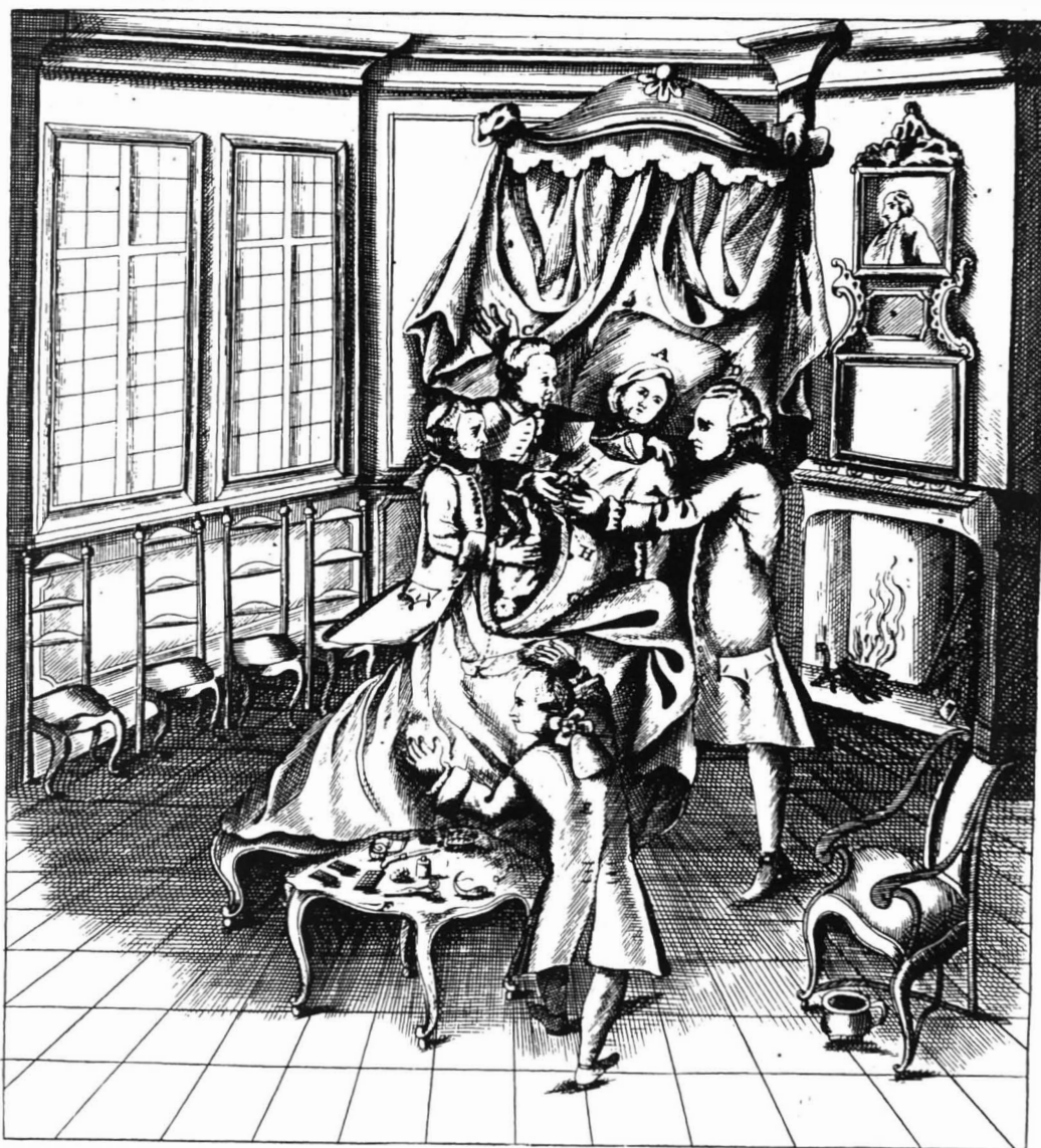
Afb. 1. Plaat III, De verlossing , uit P.J. van Bavegems "Tractaet ... over de beruchte keyzers-snede" (Dendermonde, 1773).

Bij deze plaatjes enige commentaar. Plaat I van zijn boek brengt een afbeelding van een aantal instrumenten en andere hulpmiddelen, gebruikt bij de