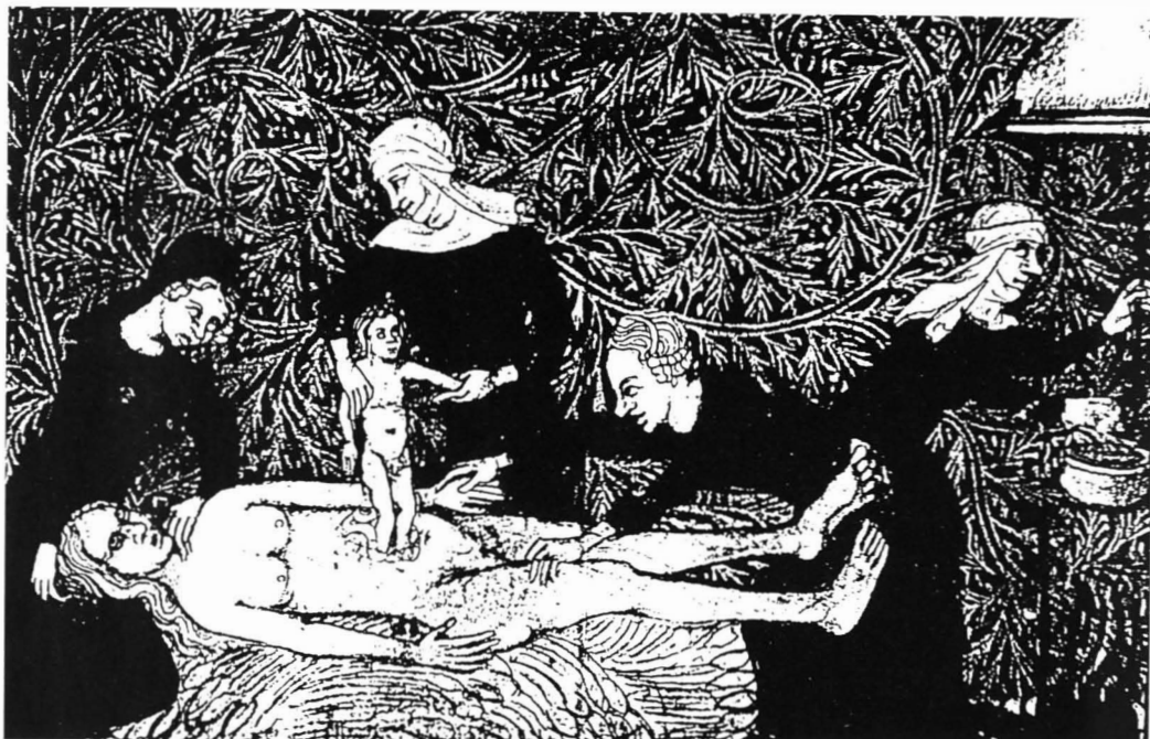
Afb. 3. Een keizersnede in een 14e-eeuws manuscript (Parijs, Bibliothèque Nationale, NAF 3576, f° 197).

rechte hand de kromme naelde is vasthoudende, waer mede hy de buyckhechting verricht." Deze afbeeldingen laten inderdaad zien dat, benevens de "operateur" zelf, niet minder dan drie assistenten bij deze keizersnede aanwezig zijn. En, bij wijze van vergelijking, nog een (zeldzame?) afbeelding van een keizersnede uit de late middeleeuwen (zie afb. 3). Deze miniatuur komt uit een 14e-eeuws manuscript "Les Faits romains" in de Nationale Bibliotheek in Parijs (NAF 3576 f° 197). Ook hier zijn vier personen (ditmaal allemaal vrouwen!) bij de operatie betrokken: het kind leeft, maar de moeder ligt levenloos op stro