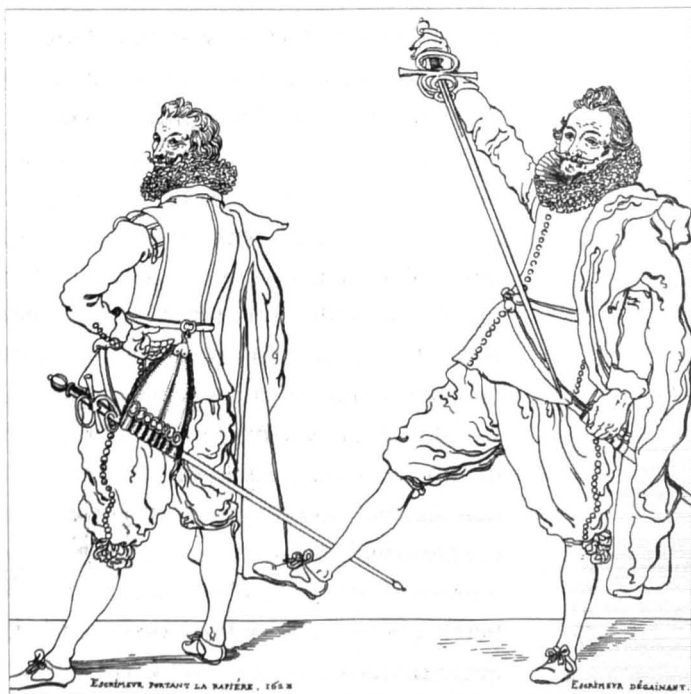
Zeventiende-eeuwse afbeelding van een schermer met rapier, uit de Atlas Goetghebuer. Gent, Stadsarchief.

groot belang was bij gevechten. In deze scholen, waartoe in principe iedereen toegang kon krijgen, werd ook onderwijs gegeven in het hanteren van andere wapens. De plaatselijke overheid was dergelijke genootschappen niet ongenegen, aangezien een goed getrainde burgerbevolking een belangrijke troef vormde voor de stedelijke verdedigingsmogelijkheden, en zo hielp om de lokale autonomie te vrijwaren. Dit soort schermverenigingen leidde mogelijk tot de oprichting van de schermgilden in de Vlaamse en Brabantse steden. (21)