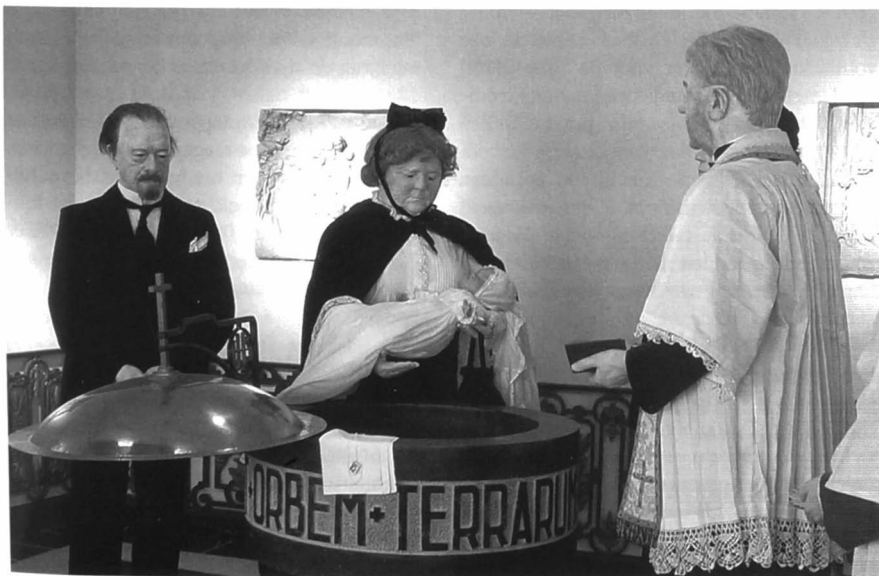
Tafereel "Het Doopsel".

In het vierde tafereel zien we de volgende stap in de levenscyclus, nl. het huwelijk.