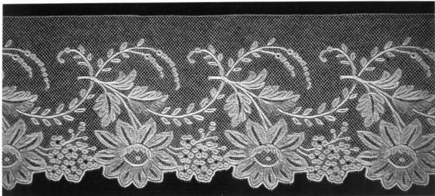
Een strook Valencienneskant met leperse tralie.

werk, kantwerk en andere werden uitgevoerd. De volledige lap die bestaat uit meerdere aaneengesnaaide jaaroefenlappen, waaraan één meisje haar ganse lagere schooltijd had gewerkt, kon een lengte bereiken van vijf tot zes meter en soms nog meer.