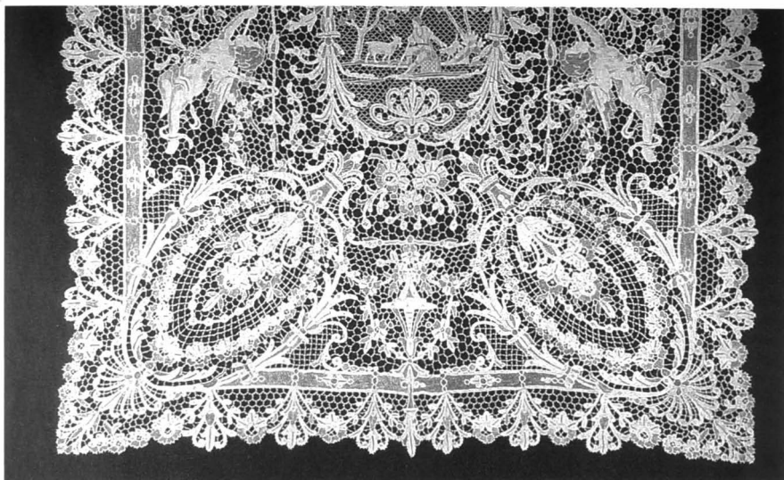
Fragment van tafelopper in Venetiaanse naaldkant.

rijke gebeurtenissen en bezigheden die zich afspeelden van wieg tot sterfbed.