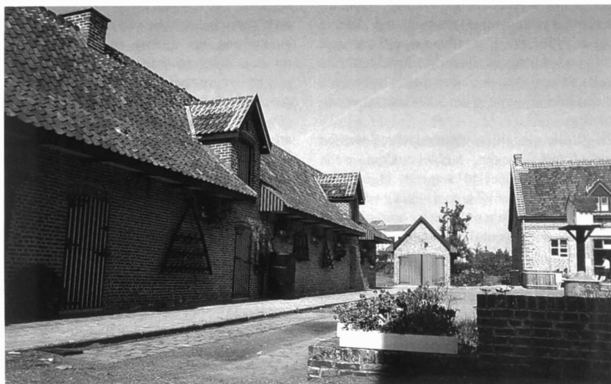
Het Nationaal Vlas-, Kant- en Linnenmuseum.

Een aantal maanden geleden werd mij gevraagd of ik een referaat kon houden op deze 'kanthappening'.