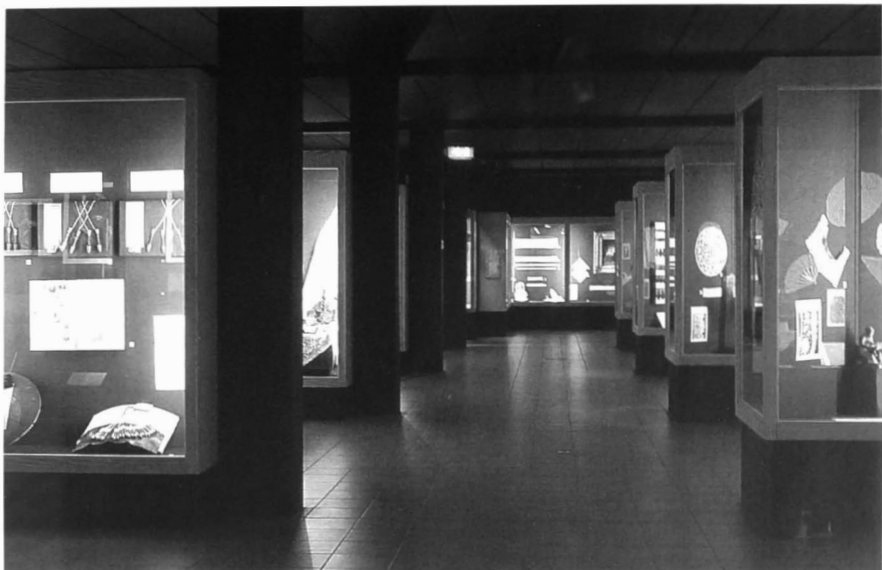
Overzicht afdeling kant- en naaldwerk (benedenverdieping).

We beginnen bij de kloskant met afgesneden draden. Dit is kantwerk dat bestaat uit afzonderlijk gekloste delen die nadien aan elkaar worden vastgemaakt tot één geheel.