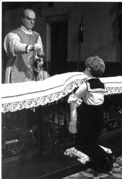
Tafereel "De Communie".

We kozen voor de bruidskamer bij een welgestelde familie uit de burgerij rond 1900. Ook hier weer is het kostbare kantwerk een volmaakte medespeler voor de rijke interieurelementen. Het bruidskleed en het kleedje van het bruidmeisje zijn prachtstukken Vlaams kantwerk. Maar ook de sierlijke bedsprei, de geborduurde lakens, de gordijnen van het hemelbed enz. zijn de moeite waard! De twee volgende tafereelen tonen de grote zorgen en de eerbied die voor het huishoud-linnen eeuwenlang werden opgebracht.