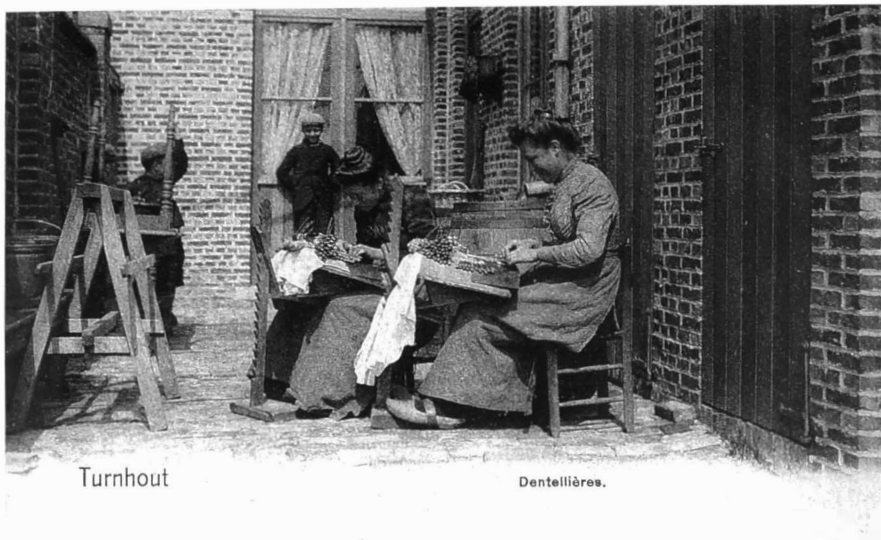
Naarstige kantwerksters klossen witte juweeltjes op de binnenkoer van hun woning. Turnhout, 1902.

1915 een Kantcomité opgericht dat actief bleef tot in 1917, wanneer het door gebrek aan geldmiddelen zijn werking moest staken. Het was zelfs verbonden met het Nationaal Hulp- en Voedingscomité. Het aantal gesteunde kantwerksters bereikte een hoogtepunt in 1916 nl. 1148, maar in maart 1917 waren ze nog met 719. Ook behoeftige werkers uit de omtrek van de stad werden gesteund. Het eerste rapport van het comité 1916 brengt volgend overzicht: