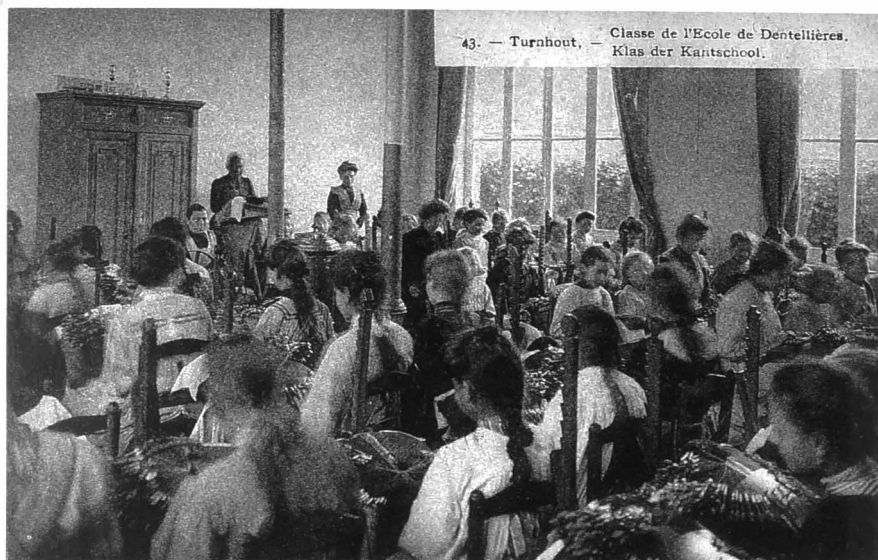
Een lokaal van de officiële Modelkantschool in de Klinkstraat. De klas was overbevolkt: de leerlingen moesten dicht bij elkaar zitten. Turnhout vóór 1914.

instaan voor het verhandelen van hun afgewerkte producten. Deze taak lieten ze over aan de handelaars.