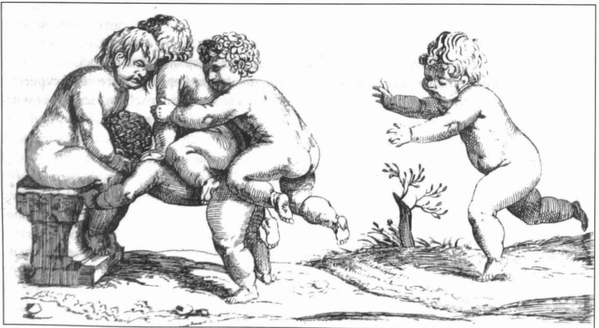
Le jeu du cheval fondu d'après une gravure de Augustin Caracci, XVIIe siècle, uit: d'Allemagne (Henri-René), Jeux et sports d'adresse , Paris, Hachette, 1939, p. 323

Als typisch volkse, landelijke spelen moet het krulbollen en de Franse variant jeu de boules vermeld, samen met kaartspelen. Ook publiekstrekkers zoals palingtrekken en eendevangen konden veel kijklustigen boeien. In Meneu kwamen er naar verluidt 2.000 mensen af op een palingvangstspel op de Leie. (53) Op een bevolkingsaantal van 4.911 mensen