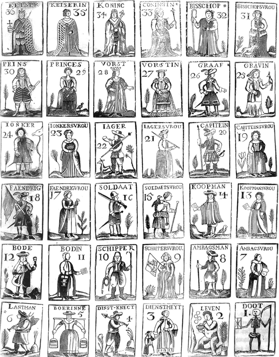
De maatschappelijke hiërarchie volgens een negentiende-eeuws 'mannekenblad' van de uitgeverij Brepols. De 'dinstknect' (sic) en 'dienstmeyt' bevinden zich onderaan de maatschappelijke ladder (Privéverzameling).