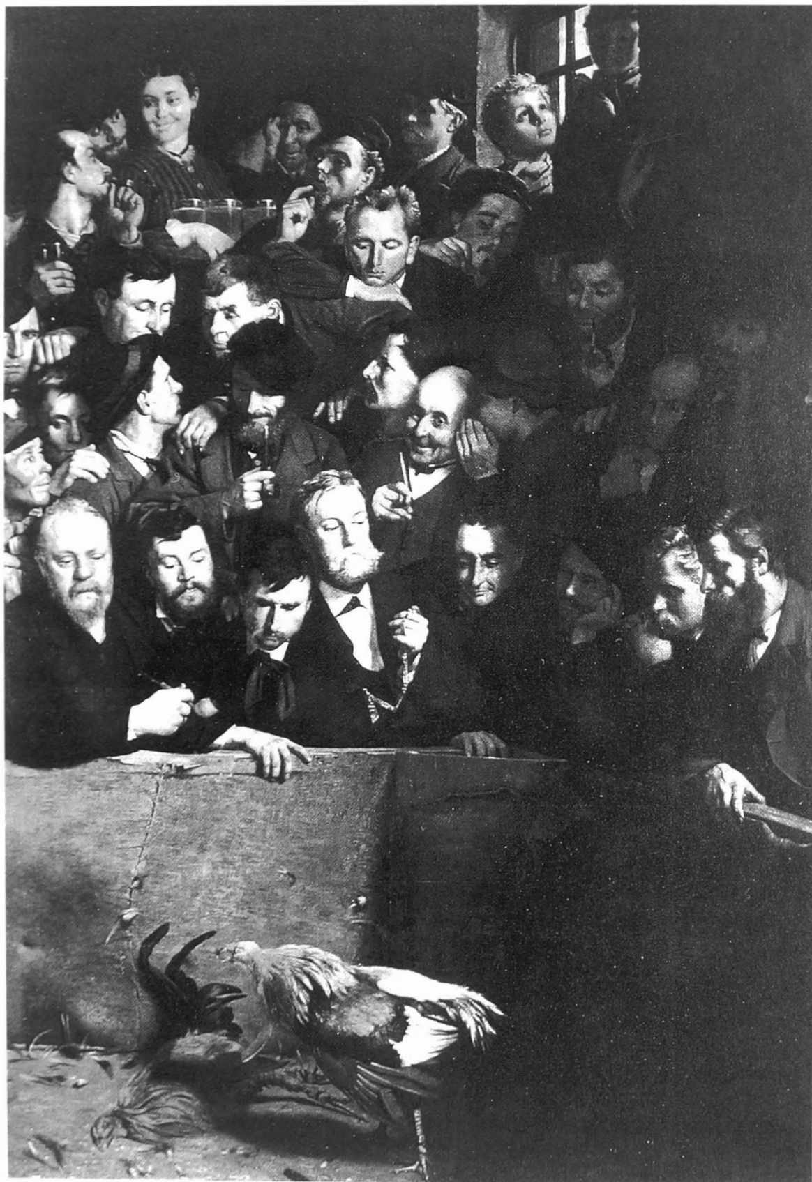
Emile Claus, Hanengevecht in Vlaanderen , 1882, privébezit.