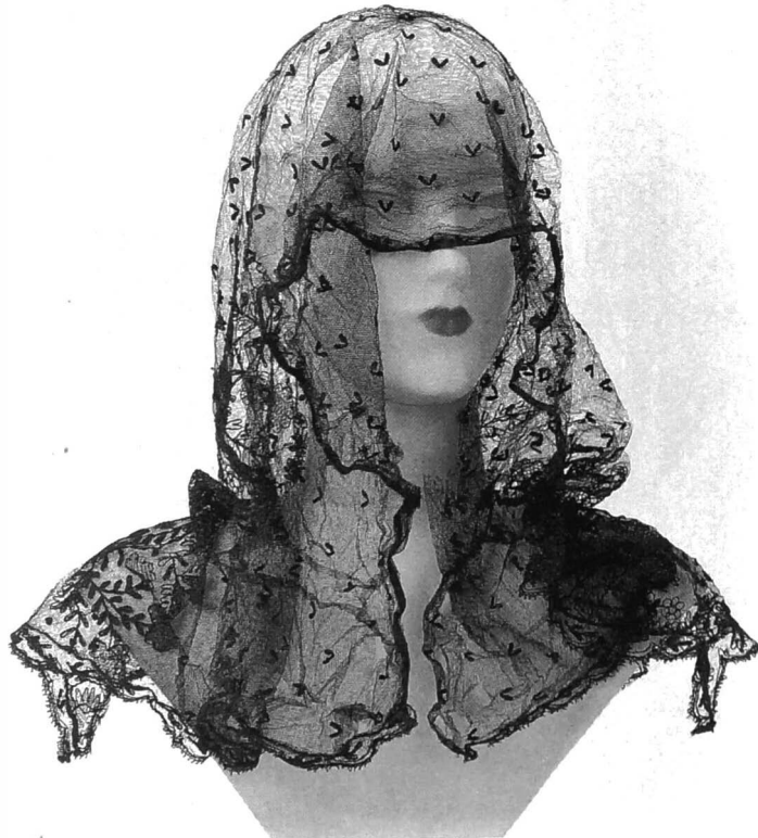
Rouwsluier, zwarte tule, h. 50 cm, br. 105 cm Verzameling Stedelijk Museum voor Volkskunde, Brugge

Op voorstel van de laatste secretaris, Joseph De Poot (1905-1998), besloten de vier overgebleven leden in 1992 om hun archief te schenken aan het Stedelijk Museum voor Volkskunde van Brugge. (1)