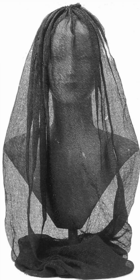
Rouwsluier, zwarte crêpe, h. 110 cm

naoorlogse vergadering gehouden, waarop naast het voltallig bestuur ook 78 leden (uit Brugge en omliggende) aanwezig waren. Op 19 oktober 1969 werd het vijftigjarig bestaan nog op grootse wijze gevierd en op 18 februari 1979 was de viering van het 60-jarig bestaan.