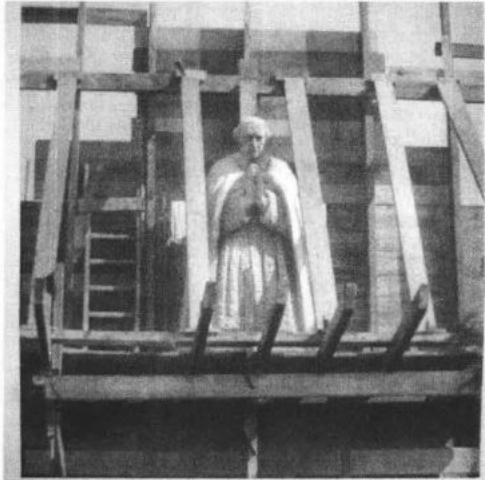
Fig. 5. - Eglise d'Elisabethville-sur-Seine. Statue du Cardinal Mercier, sculptée dans le béton entre 9 h. du matin et 6 h. du soir, le même jour, c-à-d. en 8 heures, sans études préalables.

paste binnen de droom van L'Arche om tot "un monde gothique modernisé" te komen. 80 De kerk, die in een recordtempo van één jaar werd opgetrokken, bracht de middeleeuwen terug "en ciment armé". 81 De drang om te vernieuwen volgens een traditie, hét neothomistisch stokpaardje, verklaart ook waarom de innoverende technische aspecten van het beeld steeds opnieuw werden beklemtoond. In het Brugse benedictijnenblad L'Artisan Liturgique , een spreekbuis voor de modernisering van de religieuze architectuur, klonk het in een onderschrift bij een foto van Merciers standbeeld op trotse wijze: "Statue de cardinal Mercier, sculptée dans le béton entre 9h du matin et 6h du soir, le même jour, c'est à dire en 8 heures, sans études préalables". Aan de grote kerkvorst, de drijvende kracht achter het thomistisch réveil kon door de rationele aanwending van moderne bouwmaterialen gestalte worden gegeven. 82