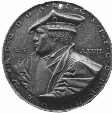
Afb. 2: Commemoratieve munt uit koper (1529) a

ten aanzien van deze gebeurtenis. 50 Hollevoet reageerde daarmee tegen het eerder aangehaalde artikel van Gilles Deregnacourt, waarin hij stelde dat de burgerlijke feestelijkheden bij Maximiliaans intocht aantoonde dat de elite het feest nog niet had opgeëist. 51 In de meeste steden was het echter verplicht voor de ambachten om aan de organisatie mee te werken door elk in hun eigen specialiteit of branche een steentje bij te dragen. De eerder aangehaalde vrije maaltijden of wijnfonteinenvormden eveneens een stimulans om ook de lagere bevolgingsklassen bij het feest te betrekken. 52