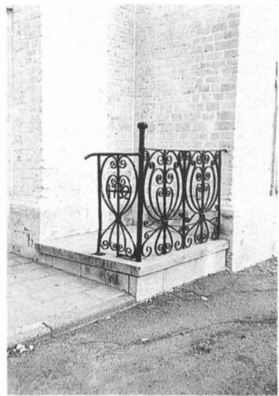
WAASMUNSTER. Kerkpui uit 1732.