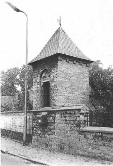
GENT, Mariakerke. Roephuisje.