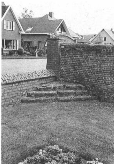
MALDEGEM, gehucht Donk. Roeptribune.