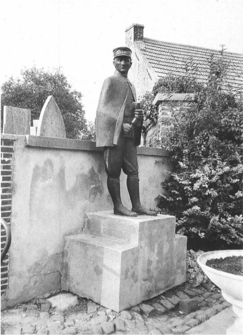
SINT-LIEVENS-HOUTEM, Letterhoutem. Evocatief standbeeld van een champetter op de roepsteen. (foto: P. De Win, 1986)