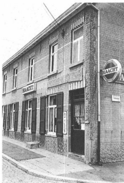
MERELBEKE, Munte. Roepsteen aan de gevel van de afspanning 'Oud Munte'. (foto: P. De Win, 1986)