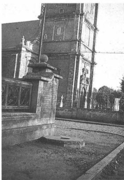
MERELBEKE, Bottelare. Schandpaaltrede als roepsteen. Thans verdwenen. (foto: F. Moens, ca. 1950)