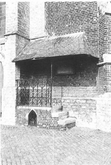
TEMSE, Elversele. Kerkpui. (foto: P. De Win, 1982)