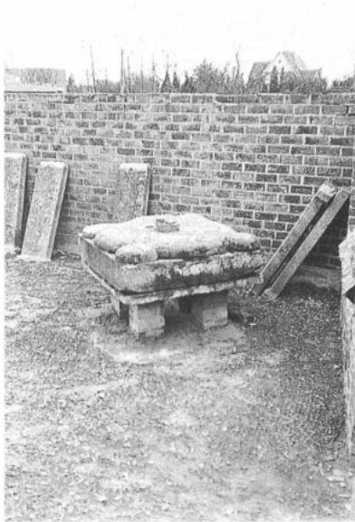
ZWALM, Meilegem. Roepsteen, waarschijnlijk de basis van een doopvont.