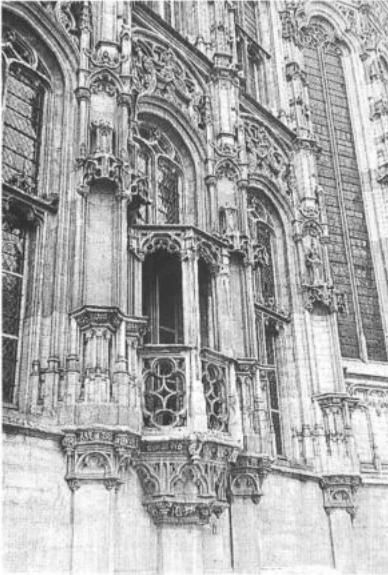
GENT. De laatgotische roepstoel van het stadhuis uit 1518-19.