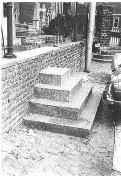
GERAARDSBERGEN, Overboelare. Roepsteen.