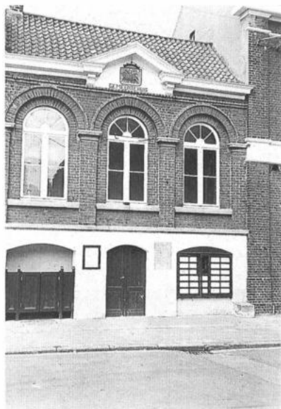
GERAARDSBERGEN, Grimminge. Roepsteen tegen de gevel van het (ex-)gemeentehuis. (foto: P. De Win, 1983)