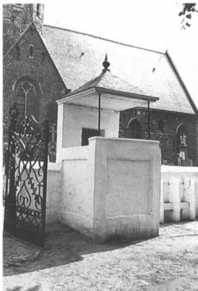
LOKEREN, Daknam. Roephuisje. (foto: P. De Win, 1982)