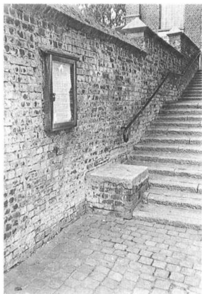
GERAARDSBERGEN, Onkerzele. Roepsteen onderaan de kerktrap.