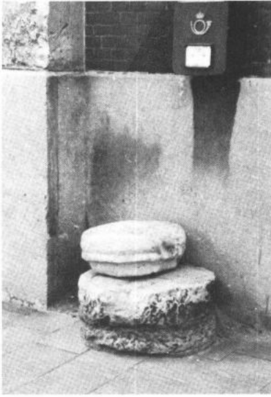
OOSTERZELE, Balegem. Ronde roepsteen met opstapje tegen de kerkgevel.