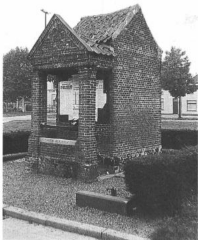
WICHELEN, Schellebelle. De roeptribune aangebouwd tegen het 'kot' (gevangenis).