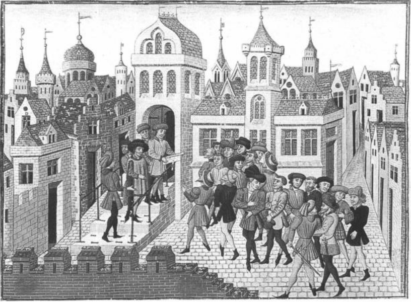
Afkondiging ter pui (ca. 1450). Anonieme miniatuur uit deel I van de Chroniques de Hainaut van Jacques de Guyse in Franse vertaling door Jean Wauquelin (Bergen, 1448). Brussel, Kon. Bibl. Albert I, Hs. 9242, f° 274v.