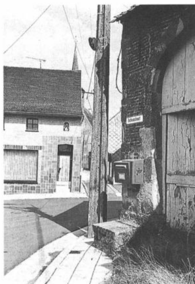
NINOVE, Eichem. Roepsteen op de hoek nabij de kerkweg.