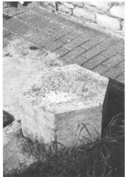
KRUISSHOUTEM, Nokere. Zeskantige roepsteen. Thans verdwenen. (foto: P. De Win, 1983)