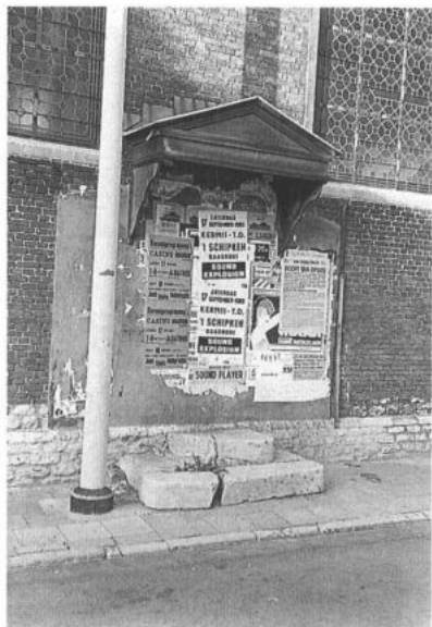
DENDERMONDE, Baasrode. Roeptribune. (foto: P. De Win, 1983)