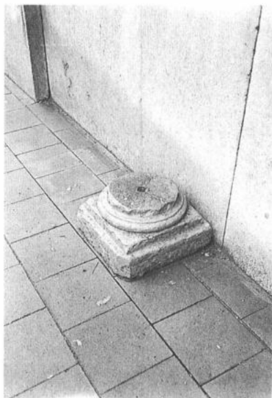
AALST, Herdersem. Een stuk zuil als roepsteen.