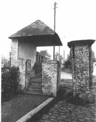
WORTEGEM-PETEGEM, Elsegem. Roephuisje (toestand 1942).