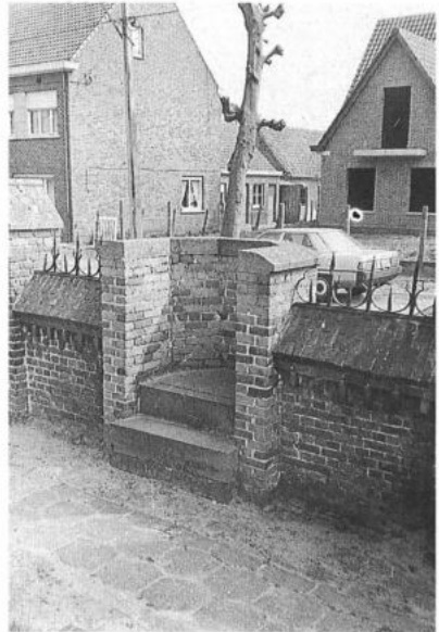
GENT, Desteldonk. Roeptribune. (foto: P. De Win, 1985)