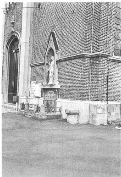
GERAARDSBERGEN, Viane. Voormalig grafmonument als roepsteen tegen de kerkgevel. (foto: P. De Win, 1983)