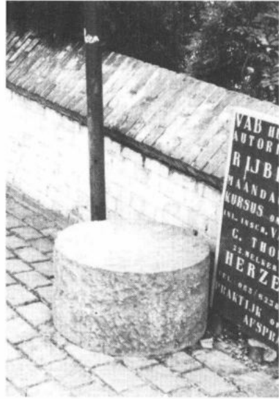
HERZELE. Cilindrische roepsteen.