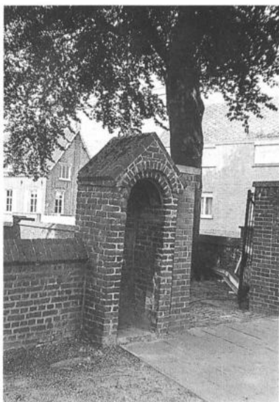
KLUISBERGEN, Zulzeke. Roephuisje. (foto: P. De Win, 1983)