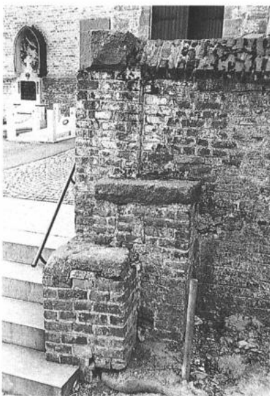
BRAKEL, Parike. Roepsteen. (foto: P. De Win, 1984)