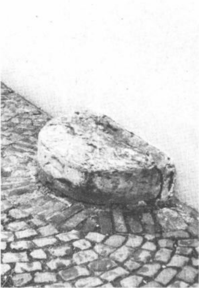
OOSTERZELE, Scheldewindeke. Halfronde roepsteen tegenover het kerkportaal.