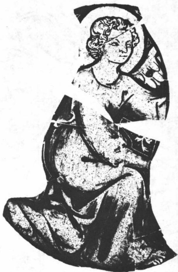
1. Engel, symbool van de evangelist Mattheus (circa 1330). Fragment van medaillon van 21 cm diameter.