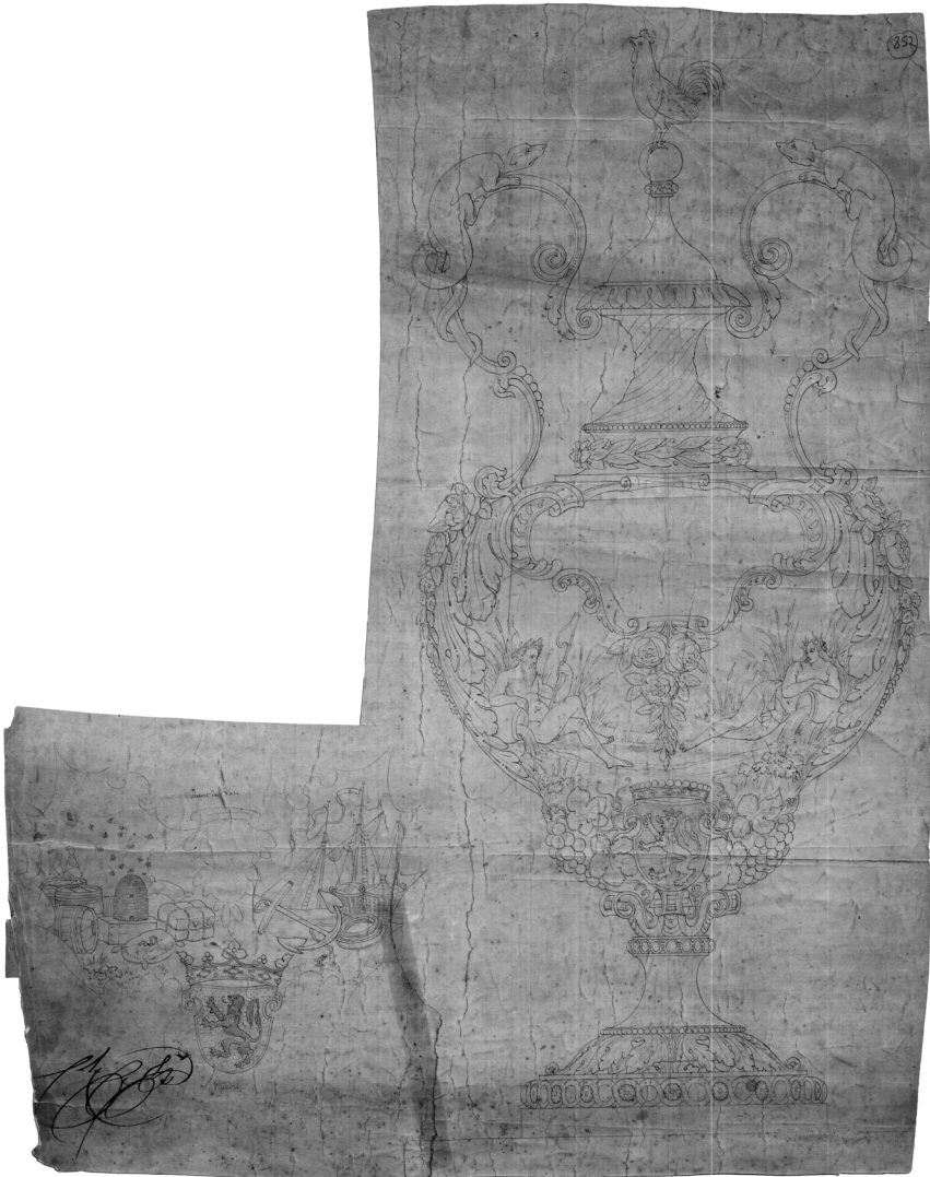
Afbeelding 9. Ontwerptekening voor de pronkbeker, Ferdinand De Bruyne, 1847 (Koksijde, Abdijmuseum Ten Duinen - collectie Bourdon, inv. 852)