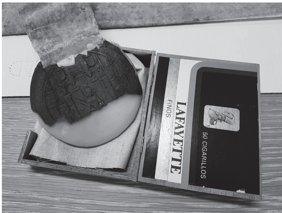
Afbeelding 2. RAG, Chronologisch supplement, nr. 951. Margaretha van Oostenrijk wordt aangeduid als landvoogdes van Karel V in de Nederlanden, 1520. Detail van toestand zegel, voor restauratie.

De oorkonden van de graven en gravinnen van Vlaanderen werden in oorsprong bewaard in de Brugse Sint-Donaaskerk, waar de kapittelproost tevens fungeerde als kanselier van Vlaanderen – zeg maar het hoofd van de grafelijke administratie. 3 Omstreeks het midden van de dertiende eeuw wijzigde de situatie en werden heel wat documenten overgebracht naar het grafelijk slot in Rupelmonde. Wellicht was deze verhuisbeweging geïnspireerd door militair-geografische redenen, namelijk naar een locatie verder weg van Frankrijk. Het ging in een eerste fase over wat wij vandaag als “statisch” archief zouden beschouwen: charters die reeds enige tijd waren afgeleverd en geen dagdagelijks administratief nut meer hadden. De nieuw geproduceerde of ontvangen charters werden daarentegen niét gedeponerd maar leidden een ambulante bestaan, zoals de grafelijke hofhouding zelf: ze reisden mee