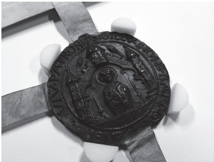
Afbeelding 5. RAG, Gaillard, nr. 712-713. De schepenen van Gent bevestigen een akkoord tussen de stad en graaf Gwijde van Dampierre over o.m. accijnzen, 1288. Detail van toestand zegel, na restauratie.

In het voorjaar van 2017 werd bij het Fonds Baillet-Latour een projectvoorstel ingediend onder de ronkende titel “Restauratie, digitalisering, ontsluiting en valorisatie van de oorkondenschat van de Graven van Vlaanderen (1086-1559), bewaard in het Rijksarchief te Gent: eerherstel voor het politiek-administratieve geheugen van het oude Graafschap Vlaanderen”. Het project – dat door het fonds werd bedacht met een subsidie van ruim € 238 000, stelt tot doel om de Gentse chartercollectie van de graven van Vlaanderen te restaureren, digitaliseren, verder ontsluiten en valoriseren. De chartercollectie van de Graven van Vlaanderen (1086-1559) telt over de vier onderdelen in totaal 4055 bestanddeelnummers en behoort tot de top van het archiefpatrimonium van de middeleeuwse Lage Landen. Ze bevat een schat aan informatie over de ontwikkeling van Vlaanderen, de grafelijke hofhouding en contacten tussen Vlaanderen en andere Europese regio’s. Uniek daarbij is het feit dat ook heel wat boekhoudkundige en juridische documenten de tand des tijds hebben overleefd, zoals hotelrekeningen, getuigenverklaringen, ... Het gaat dus alerm minst over een “chartrier” in de meest strikte zin van het woord, zowel inhoud-