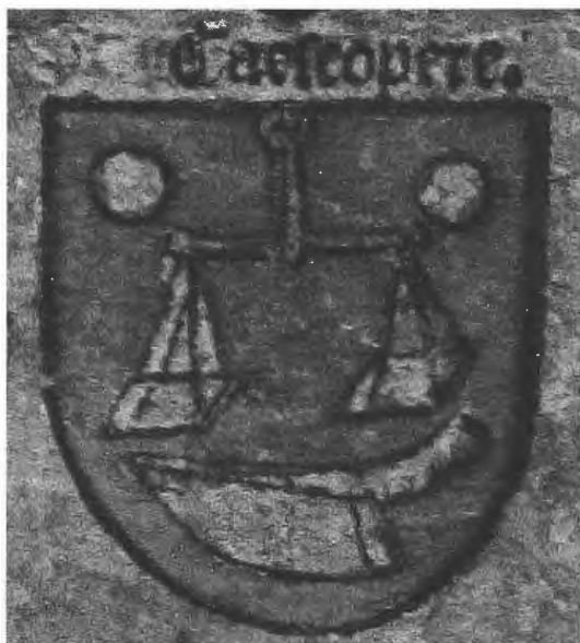
Afbeelding 1 - Het wapen van de zuivelverkopers toont wat zij mochten doen: kaas en boter snijden en afwegen.

In het eerder vermelde rapport-De Smet van het midden van de 15de eeuw kwamen er ook bepalingen voor over de handelspraktijk, maar de baljuw en de schepenbank veegden heel wat artikelen van tafel. Het bestuur van de nering eiste dat de gezworenen te allen tijde de schalen en gewichten konden controleren, maar dit werd overbodig geacht omdat die in ieder geval dienden te beantwoorden aan de stedelijke ijkingvoorschriften. Even overbodig was de bepaling dat de vrije zuivelverkopers binnen Gent veinstre houden, winckle noch toegh zou maken van zuvele op zondagen, vigiliedagen of op Onze-Lieve-Vrouwedagen overmids dat de heleghe kerke up zulcdaneghe daghen alle coopmanscepen verbiedt . De bepaling dat onvrije verkopers hun kaas of boter niet mochten afwegen werd geschrapt, omdat dit tot de voorrechten van de nering van de zuivelverkopers behoorde. Onvrije personen mochten hun zuivel immers per stuk verkopen, terwijl enkel de leden van de nering kaas mochten versnijden en per gewicht verkopen. Dit privilege werd duidelijk zichtbaar voorgesteld op het wapenschild van de Gentse nering, met twee kaasbollen, een balans en een kaasmes. 32