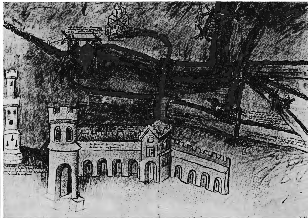
Schematische voorstelling van de waterstaat vóór Nieuwpoort, met de lokalisatie van de monding van de IJzer, de Lekeleed en de Ieperleed, evenals van de bruggen, sluizen en „t Saghers overdrach”. Gans links fiktieve afbeelding van de „grote vierboete” en van een stadstoren, deel uitmakend van de stadsmuur. Akwarel op ruw papier, behorend bij een akte van 1416. Brussel, Algemeen Rijksarchief, Kaarten en plannen, nr. 6059.