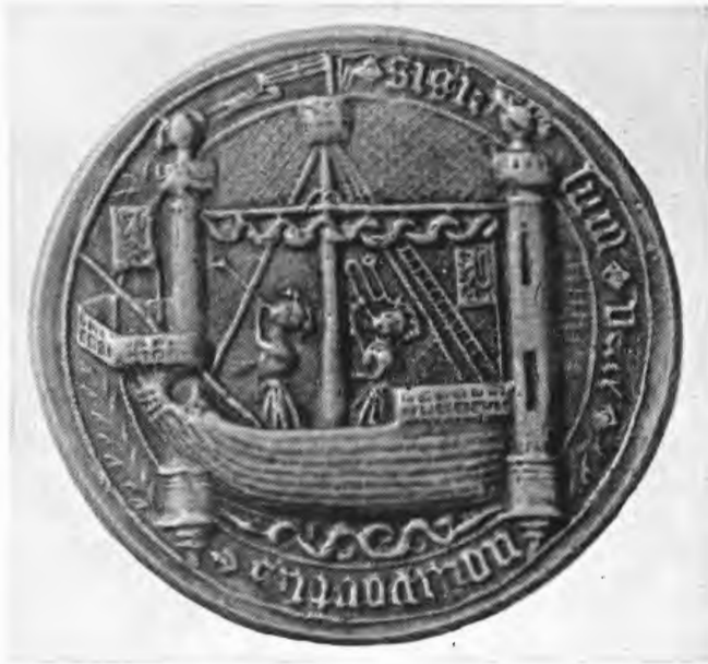
Zegel van de stad Nieuwpoort, bevestigd aan verschillende akten van 1472. Afbeelding van een bewapend schip, omlijst door twee hoge torens, elk met bovenop een wachter, wat doet denken aan de twee „vierboetes”, elk met hun „vierboeter”. Brussel, Algemeen Rijksarchief, zegelverzameling, nr. 19649.