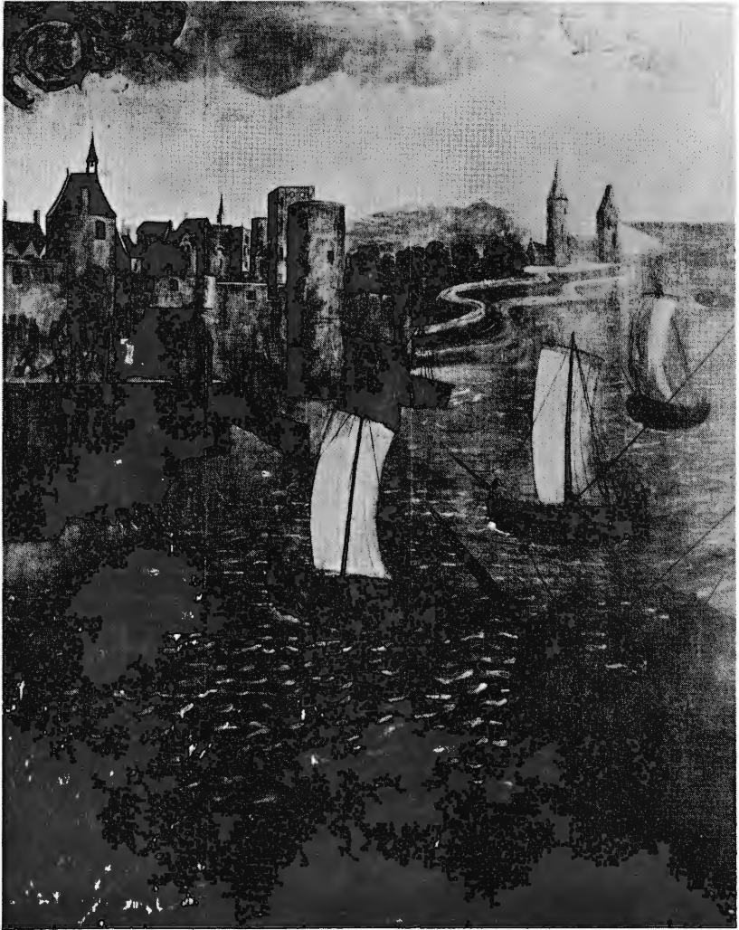
Schilderij uit twee delen, zijnde de achterzijden van de twee zijpanelen van een drieluik, toegeschreven aan Lanceloot Blondeel (1496 ? - 1561). Zicht op de haven van Nieuwpoort met de kaai, de kraan, de stadsmuur en de rede met haar vaartuigen. Hier, op deel II, uiterst rechts, de grote en de kleine „vierboete" met de er naartoe leidende wegen. Nieuwpoort. Stadhuis. Eigendom van de stad.