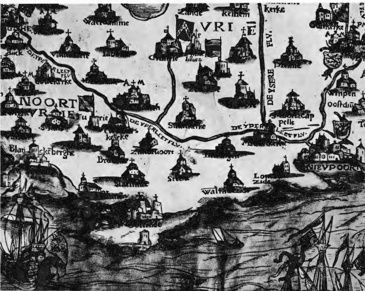
Detail uit de oudste gedrukte kaart van het graafschap Vlaanderen door Pieter van der Beke, van 1538. Houtsnede bewaard in het Germanisches Nationalmuseum te Nuremberg. Hier de kuststrook tussen Blankenberge en Nieuwpoort met de lokalisatie van de aldaar gelegen steden, dorpen, kerken en „vierboetes”. Let op de ligging van de „vierboetes” van Blankenberge en Oostende, respectievelijk telkens op overgebleven gedeelten van de vroegere meer vooruitgeschoven kust.