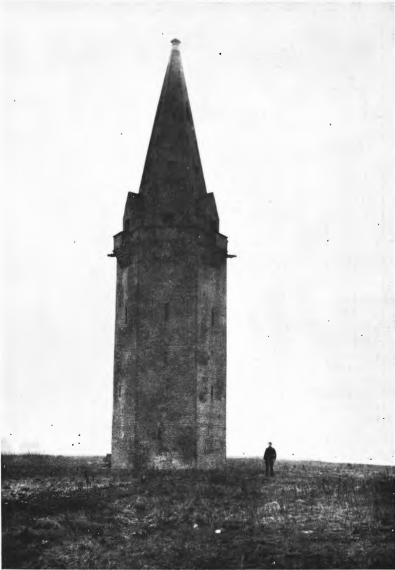
De „grootte vierboete” te Nieuwpoort omstreeks 1900 na haar laatste restauratie. Zo ongeveer moeten in de 16de eeuw ook de „vierboetes” van Oostende, Blankenberge en Heist er uitgezien hebben. - Cliché van vóór 1914.