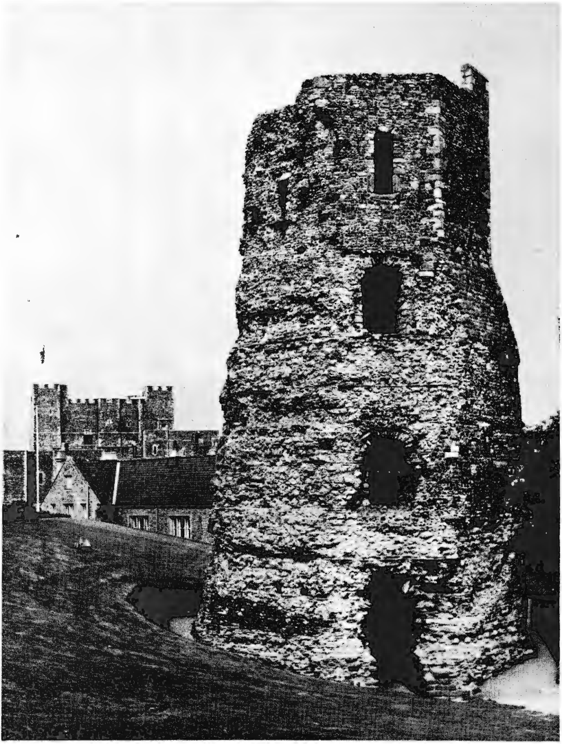
De antieke vuurtoren op Castle Hill te Dover, huidige toestand. Het achthoekige piramidale gebouw telt nog drie verdiepingen, waarvan de derde middeleeuws is, heeft een hoogte van 80 voet of ongeveer 26,5 meter en verheft zich op genoemde heuvel ongeveer 375 voet of 125 meter boven de zeespiegel.