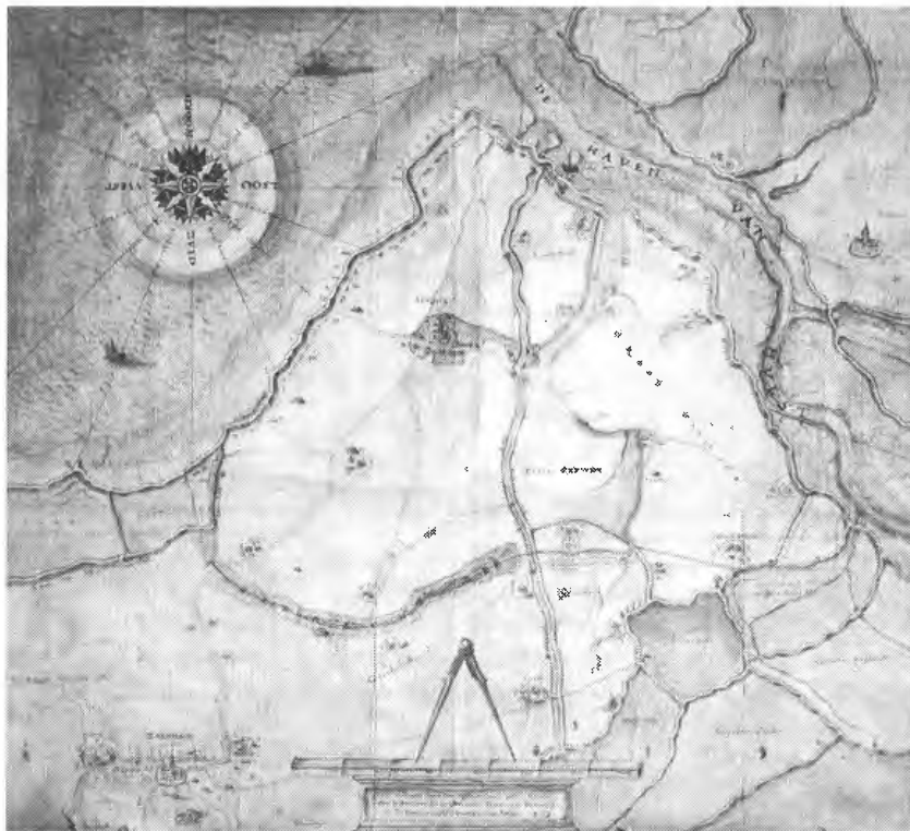
3. Kaart van Franchois Horenbault uit 1569 met de evering Copwijck en daarin enkele hoeven van De Bijloke (Rijksarchief Gent, Kaarten & Plans, 2547)

Volgens het uit 1562 daterende everingboek van Copwijck bezat het klooster hier 575 gemeten en 110 roeden, terwijl de andere wat vroegere en latere bronnen eenduidig een omvang van wat boven 600 gemeten aangeven. 31 Waar dit verschil vandaan komt, blijft onduidelijk. Verder bezat het klooster in de overige polders rondom Zaamslag volgens de everingboeken van de Zaamslagpolders ca. 616 gemeten, hetgeen vrijwel overeenkomt met de andere bronnen. 32 De