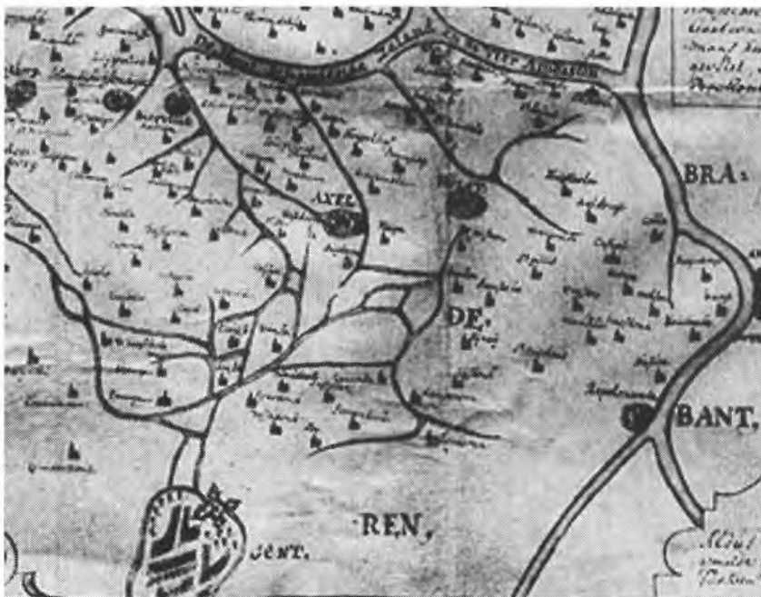
1. Fragment van de zgn. Dampierre-kaart. Het gebied met de Vier Ambachten benoorden Gent circa 1280 (Rijksarchief Gent, Kaarten & Plans, 812)

We richten in het bijzonder de aandacht op de opbouw en omvang van het grond- en tiendbezit van De Bijloke in de Vier Ambachten. 4 Het gaat hier overwegend