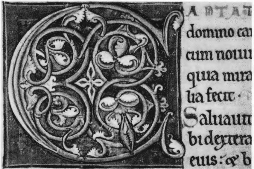
Versierde initiaal uit een dertiende-eeuws psalterium (Bib. Dom. A 46, f° 86r)