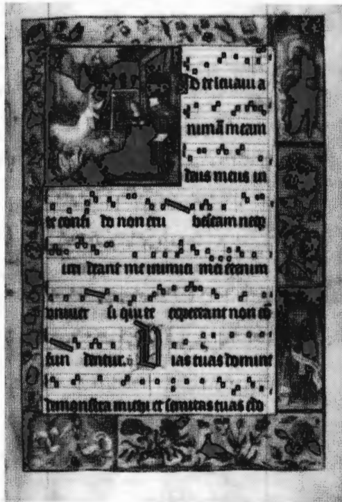
Graduale vervaardigd door Nicolaes van Rosendael, o.p. / te 's Hertogenbosch in 1515 (Bib. Dom. A 65A1, f° 1r).