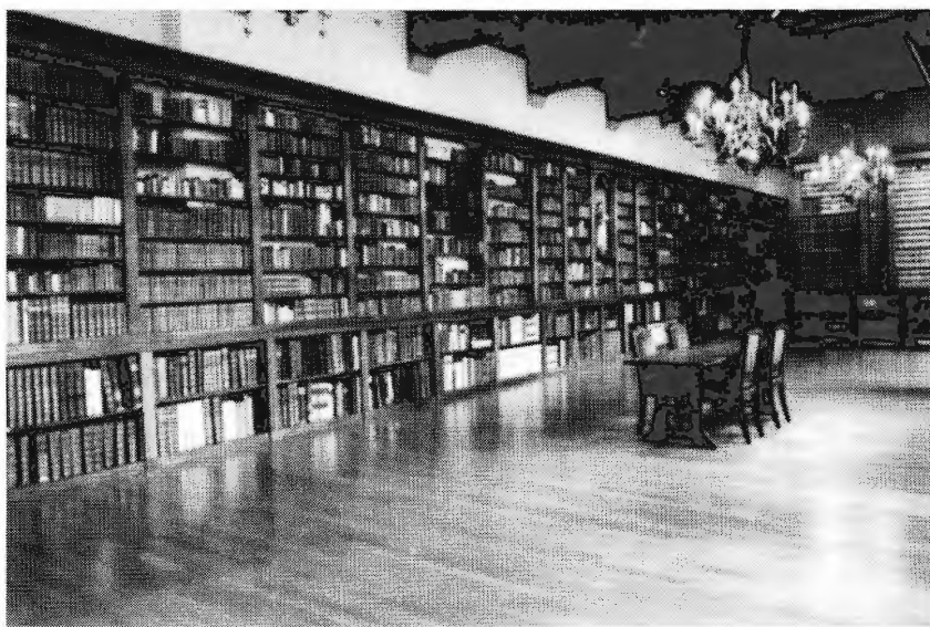
De huidige Bibliotheca Dominicana, zoals deze opgesteld staat in 'Het Pand'

De eigenlijke sermoenencollectie begint ca 5970. Hieronder bevinden zich florilegia zoals G. Mansi, Locupletissima bibliotheca moralis praedicabilis , Antwerpen, 1701 (of) V. Houdry, La bibliothèque des prédicateurs, qui contient les principaux sujets de la morale chrétienne , 4 bdn, Lyon, 1716-1717(2), naast sermoenenverzamelingen van afzonderlijke auteurs (Bernardus van Clairvaux, Tauler...). De dominicaanse predikanten hadden ook voorbeelden om kort en goed te preken, b.v. Sermoenen van vijf minuten of vroegpreken voor al de zondagen van het jaar door de priesters der congregatie van de H. Paulus te New York... , Mechelen, 1883 en prekenbundels voor speciale doelgroepen (meestal vrouwen of kinderen). Tot de groep sermoenencollecties kunnen we ook de werken met retraite-onderwerpen rekenen. Deze groep wordt onderbroken door de reeks van V. van Tricht over natuurfenomenen (huisdieren, gletsjers, vogels,