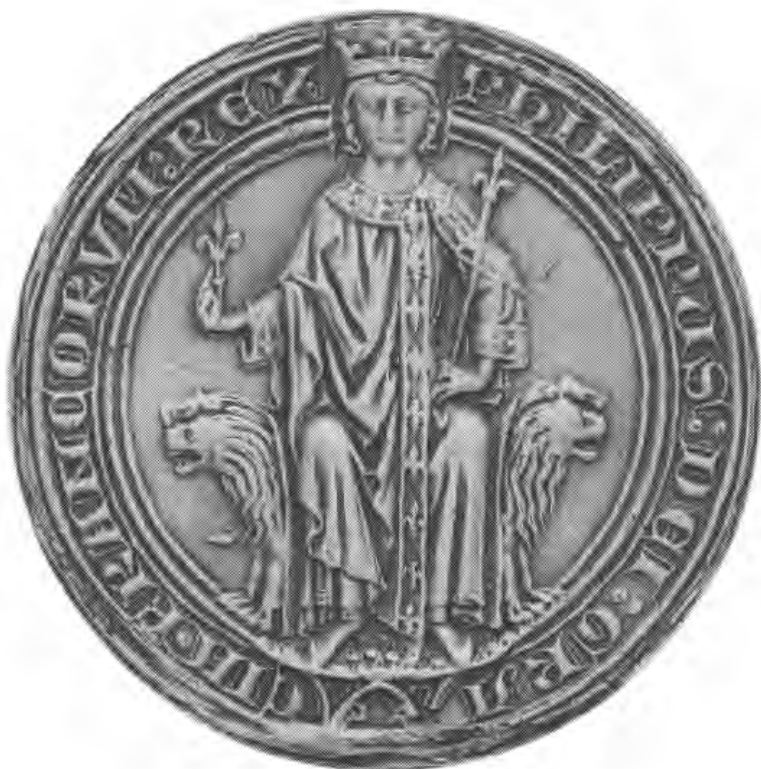
Bibliothèque Nationale de France, dép. Manuscrits, Paris

van koning Filips IV in groene was op dubbele staart van groene en rode zijde door de plica aangebracht 93 . Dit zegel (cf. afbeelding I) heeft als legende (nog gedeeltelijk leesbaar op het Parijse origineel van het 'charter van Senlis'): ' Philippus Dei gracia Francorum Rex '. Het tegenzegel is het klassieke type: een schild met lelies. Het zegel bleef enkel aan het in Parijs aanwezige exemplaar (hier: A1) bewaard.