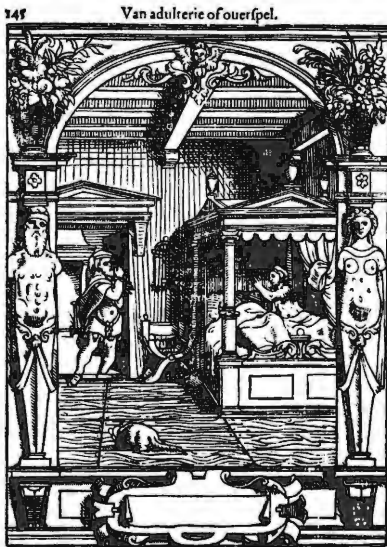
Overspel bij Damhouder

betrekken. Want er rijst toch wat twijfel: als mannen zo domineren in de statistieken, waarom werden dan steeds vrouwen afgebeeld als overspelige of als bordeelmadam? Talrijke contemporaine iconografische voorbeelden tonen vrouwen in de rol van hoerenwaardin of overspelige echtgenote. Denken we maar aan de Practycke ende handbouck in criminele zaeken van Joost de Damhouder (1551). 15 In dit juridisch traktaat wordt overspel voorgesteld door een vrouw die naast haar echtgenoot in het echtelijke bed ligt, maar tegelijkertijd teken doet naar haar minnaar die de slaapkamer binnenkomt. Bij prostitutie zien we als typevoorbeeld een oude vrouw op de voorgrond die over de prijs onderhandelt met een mogelijke klant. De geldbeugel is zeer prominent aanwezig en zet in de verf dat zij leeft van de prostitutie van anderen.