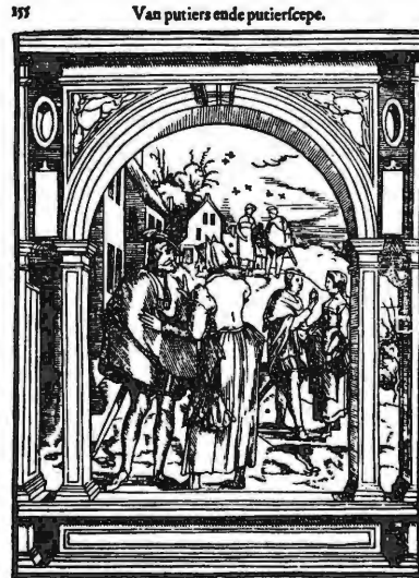
Pooierij bij Damhouder

Andere voorbeelden van de vrouwelijke stereotypering van bordeelexploitatie en overspel zijn een illustratie van De Verloren Zoon 16 , die de zwakkeling toont in het bordeel omringd door een prostituee en haar hoerenwaardin, en een houtsnede uit Dat bedroch der vrouwen die een vrouw toont in bed in de armen van haar man, terwijl een ander zich onder het bed verstopt. 17