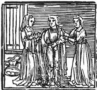
De verloren zoon in het bordeel