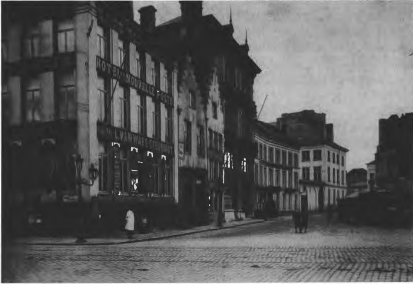
5. Het voormalige Coelsteen alias Hotel de la Nouvelle Poste en de Sterrenstraat, omstreeks 1906