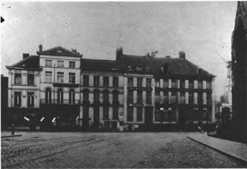
6. Het voormalige Coelsteen alias Hotel de la Nouvelle Poste aan de Kleine Korenmarkt, omstreeks 1906