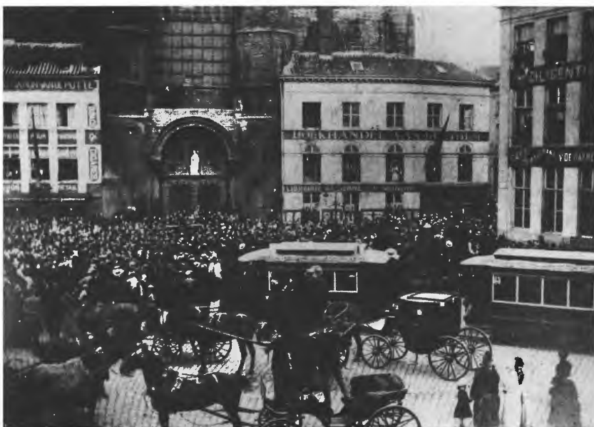
4. De hoek van het voormalige Coelsteen met de smalle doorgang naar de Kleine Korenmarkt, bij de plechtige ontvangst in 1886 van de kunstschilder Constant Montald (Gent 1862 – Brussel 1944) toen hij de Prijs van Rome had ontvangen