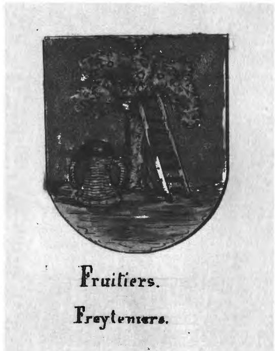
2. Het wapenschild van de Gentse fruitverkopers, uit: DE VIGNE, F., Recherches historiques sur les costumes civils et militaires des gildes et des corporations de métiers, leurs drapeaux, leurs armes, leurs blasons, etc. , Gand, 1847; en SAG, Historische nota's nr. 13