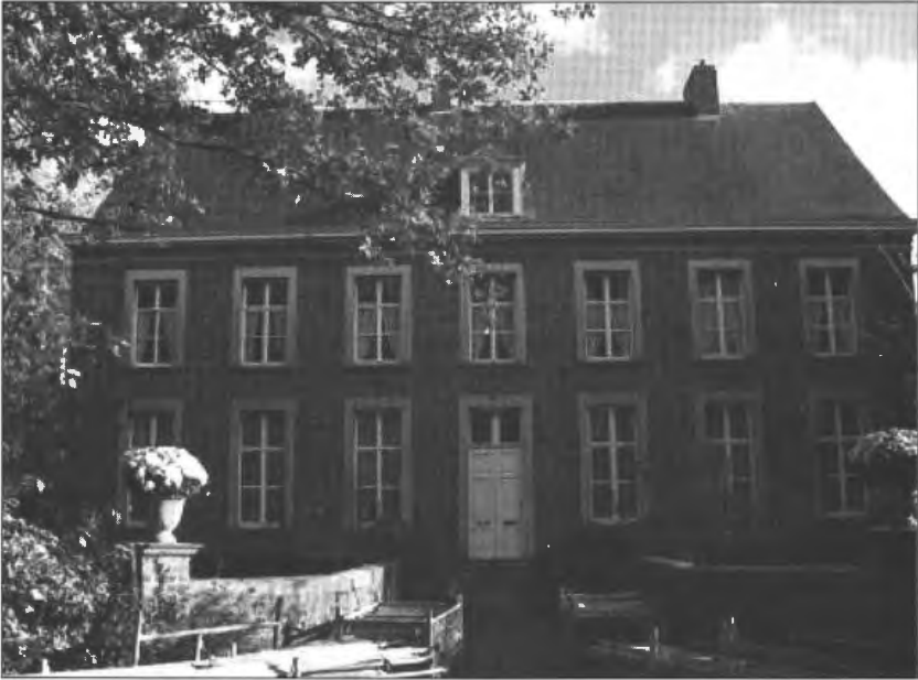
Afbeelding 5: Voorgevel van de achttiende-eeuwse pastorie.

Van eind augustus tot en met november 1790 werd verscheidene malen hout geleverd. Enerzijds werd rond grenenhout uit Riga en Noords vurenhout geleverd door Bernardus Speelman. 68 Dit hout werd vermoedelijk gebruikt voor het bouwen van stellingen. Anderzijds werd eikenhout geleverd, dat volgens de rekeningen gebruikt werd voor kinderbalken, gordingen en grote kepers. 69 Nog in november 1790 werden er 15650 leien geleverd door J. De Lapaille, meester tegel- en leienlegger. Zij werden door vier van zijn knechten gelegd. 70 In het begin van het jaar 1791 leverde L. De Smet verscheidene soorten nagels als late nagels, seskens nagels, oortjens nagels en latijzers. 71 Latijzers of lat-spijkers zijn spijkers die gebruikt worden bij bekappingen, om de latten op de kepers te bevestigen. 72 Wat de exacte betekenis van late, seskens en oortjens nagels is, is niet gekend. Vermoedelijk zijn het benamingen van spijkers met een verschillende afmeting en puntscherpte. De huidige dakconstructie dateert nog van deze bouwperiode. Het is een gordingenkap van vijf spanten, allen voorzien van gesneden telmerken. De leien werden in de jaren '70 van de twintigste eeuw vernieuwd.