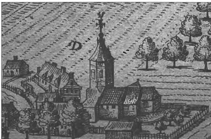
Afbeelding 2: Detail van de prent van Sanderus waarop rechts de kerk van Zwijnaarde en links de pastorie zijn afgebeeld, 1641.

Op de prent van Sanderus wordt de omheining in het westen onderbroken door een poortopening, overdekt met een zadeldak. De poort is met een brug over een lager gelegen deel dat tijdelijk water bevatte, verbonden met een tweede poort die direct uitgeeft op de straat. De aanwezigheid van water dat de pastorie zou omringen, is echter niet duidelijk weergegeven op de prent. Enkel de hoger gelegen verbinding tussen beide poorten doet denken aan een eventuele overbrugging boven een lager gelegen waterpartij. In het vermelde visitatieverslag van bisschop Antonius Triest is er wel sprake van water dat de volledige site omringt.