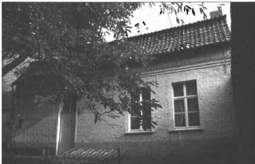
Afbeelding 3: Voorgevel van de oude pastorie in classicerende barok, aangepast in de periode 1736-1738.