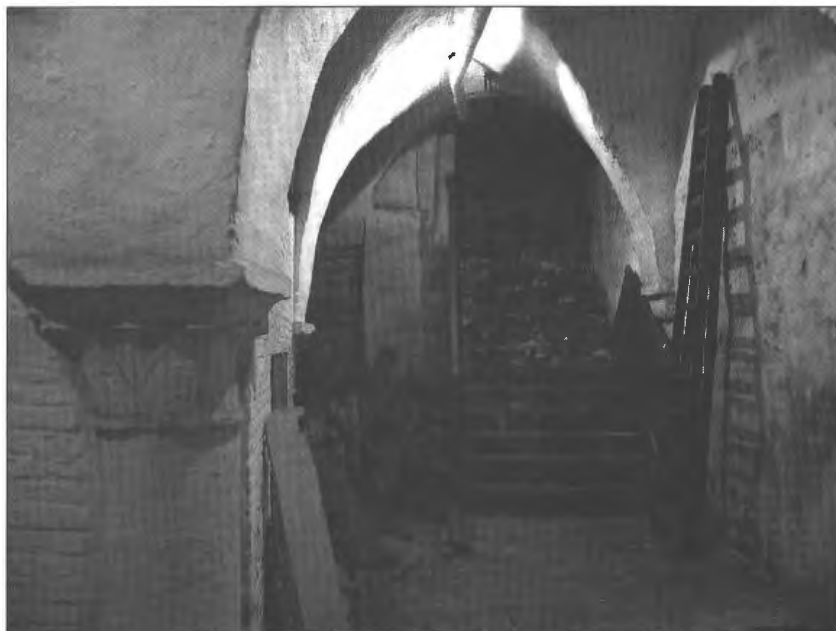
Afbeelding 2: Op kelderniveau bleef het middeleeuwse huis zeer goed bewaard.