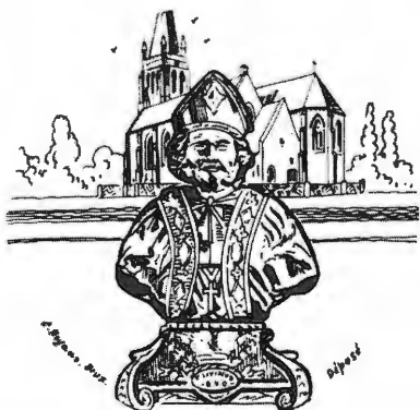
Afb. 2. Bedevaartvaantje (detail) van Livinus uit Elverdinge bij Ieper, waar omstreeks 1800 een houten reliekborstbeeld van de heilige werd verworven. (foto uit Van der Linden, Bedevaartvaantjes , afb. L54).