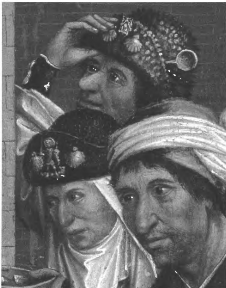
Afb. 12. Bedelende pelgrims (detail), geschilderd altaarstuk, omstreeks 1490, Frankfurt, St. Annenkapelle in de Karmelietenkerk.