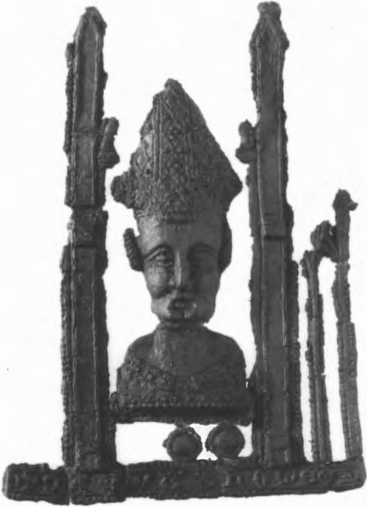
Afb. 10. Pelgrimsinsigne van Thomas Becket, loodtin, tweede helft van de veertiende eeuw, opgegraven in Valkenisse (Zeeland) (foto Van Beuningen, Koldewij, Heilig en Profaan, p. 198 afb. 361).