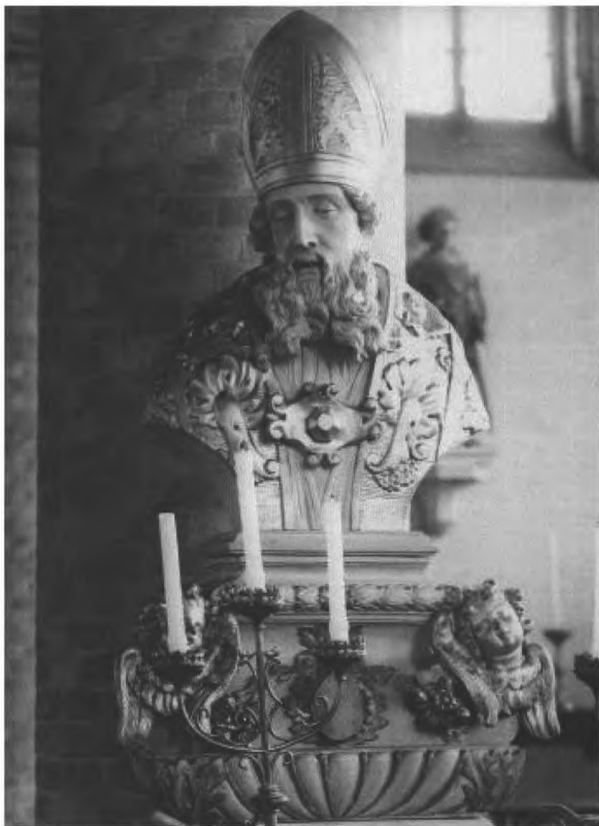
Afb. 8. Gepolychromeerd houten reliekborstbeeld van Livinus, negentiende eeuw, Ramskapelle (Nieuwpoort), Kerk Sint Laurentius.