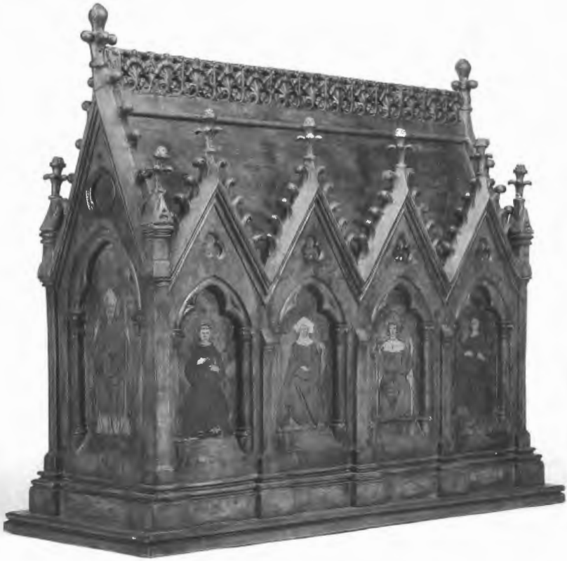
Afb. 1. Gepolychromeerd houten reliekschrijn van Livinus, laat vijftiende of vroeg zestiende eeuw, Sint-Lievens-Houtem, Sint-Michielskerk (foto Brugge, Stadsfotografen Jan Termont, Dirk Van der Borgh).