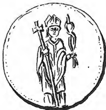
Afb. 3. Koperen Livinusmedaille uit het Noordfranse Merck-Saint-Liévin (bij Saint-Omer), zestiende eeuw (tekening uit Dancoisne, Les médailles religieuses , p. 104, nr. 284).