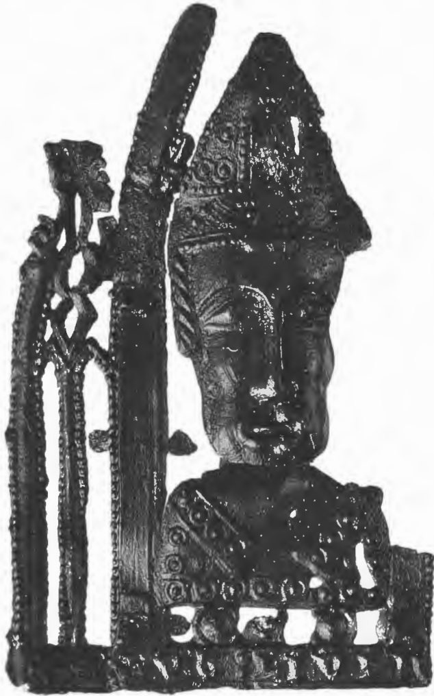
Afb. 5. Pelgrimsinsigne van Livinus, loodtin, tweede helft veertiende eeuw, Hoorn (Noord-Holland), Archeologische Dienst.