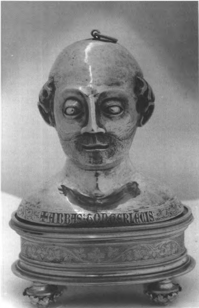
Afb. 6. Gedreven zilveren reliekhoofdje van Livinus, midden veertiende eeuw, Maastricht, Sint-Servaaskerk.