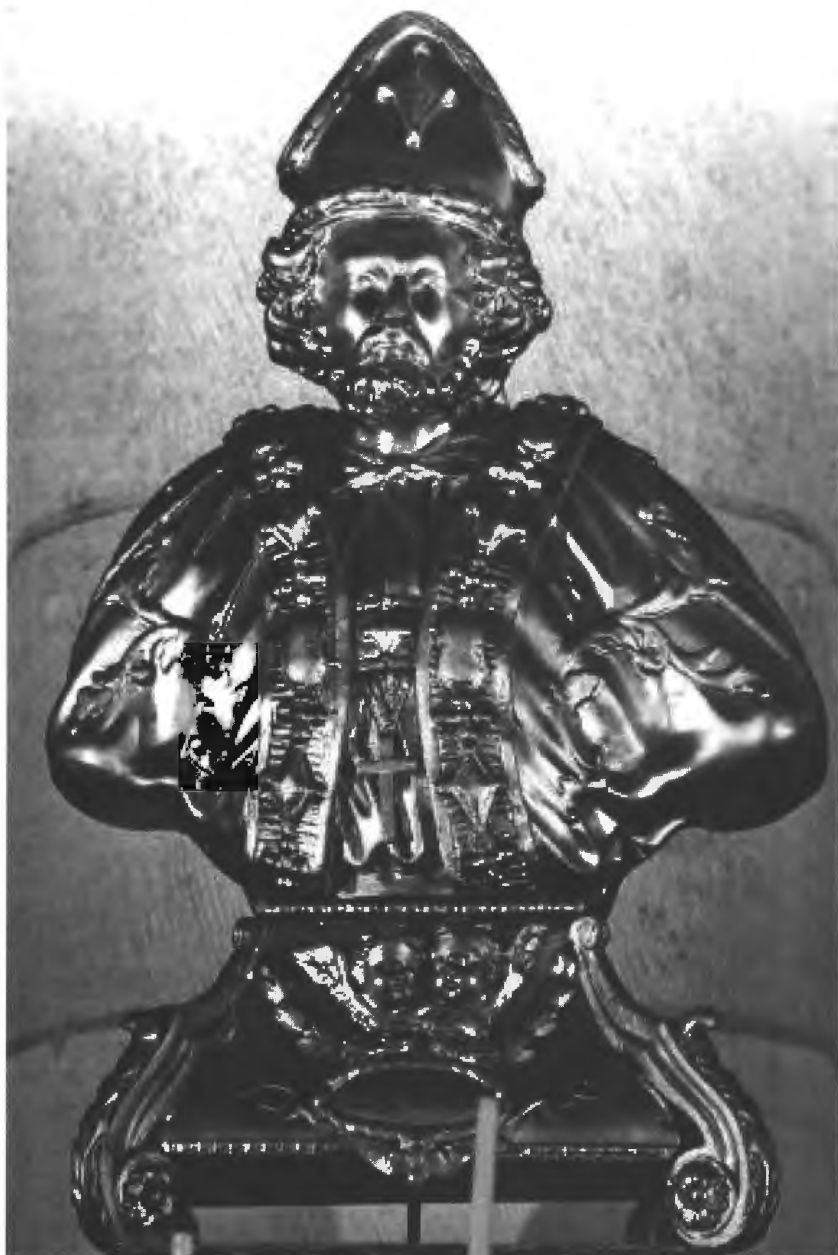
Afb. 7. Verguld houten reliekborstbeeld van Livinus, omstreeks 1800, Elverdinge, Kerk Sint Petrus en Paulus.