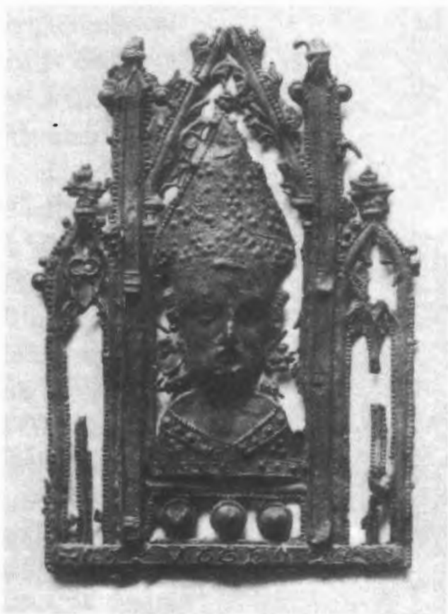
Afb. 9. Pelgrimsinsigne van Thomas Becket, loodtin, tweede helft van de veertiende eeuw, opgegraven in Londen.