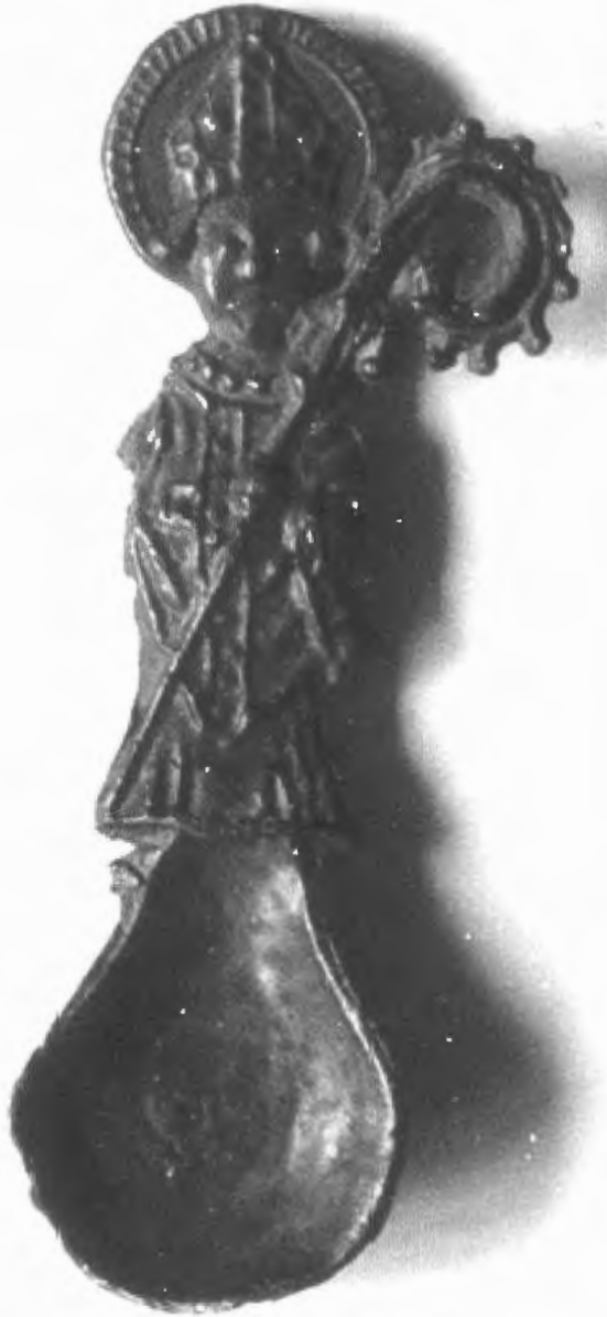
Afb. 13. Insigne in de vorm van een Livinuslepel, loodtin, . Brussel, Munt- en Penningkabinet, Koninklijke Bibliotheek Albert I.