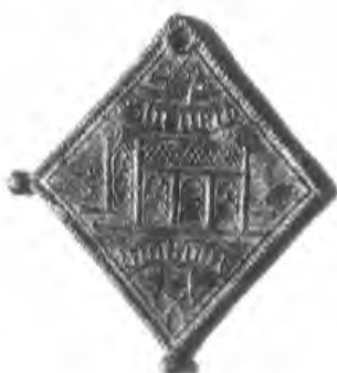
Afb. 4. Livinus-insigne uit Gent, loodtin, begin zestiende eeuw, Rotterdam, Museum Boijmans Van Beuningen; op de voorzijde troont Livinus, op de keerzijde is zijn reliekschrijn afgebeeld.