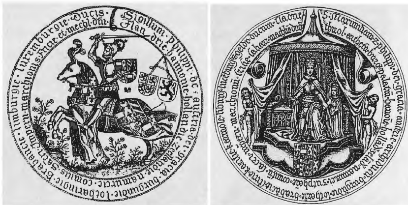
Abbeeldingen 1 en 2: links het zegel van Filips de Schone dat de regentschapsraad hanteerde, rechts het zegel dat Maximiliaan liet ontwerpen. 36

en het zegel propageerden dus het standpunt van de regentschapsraad want het beschouwde Filips als een autonome graaf, die zonder zijn vader kon regeren.