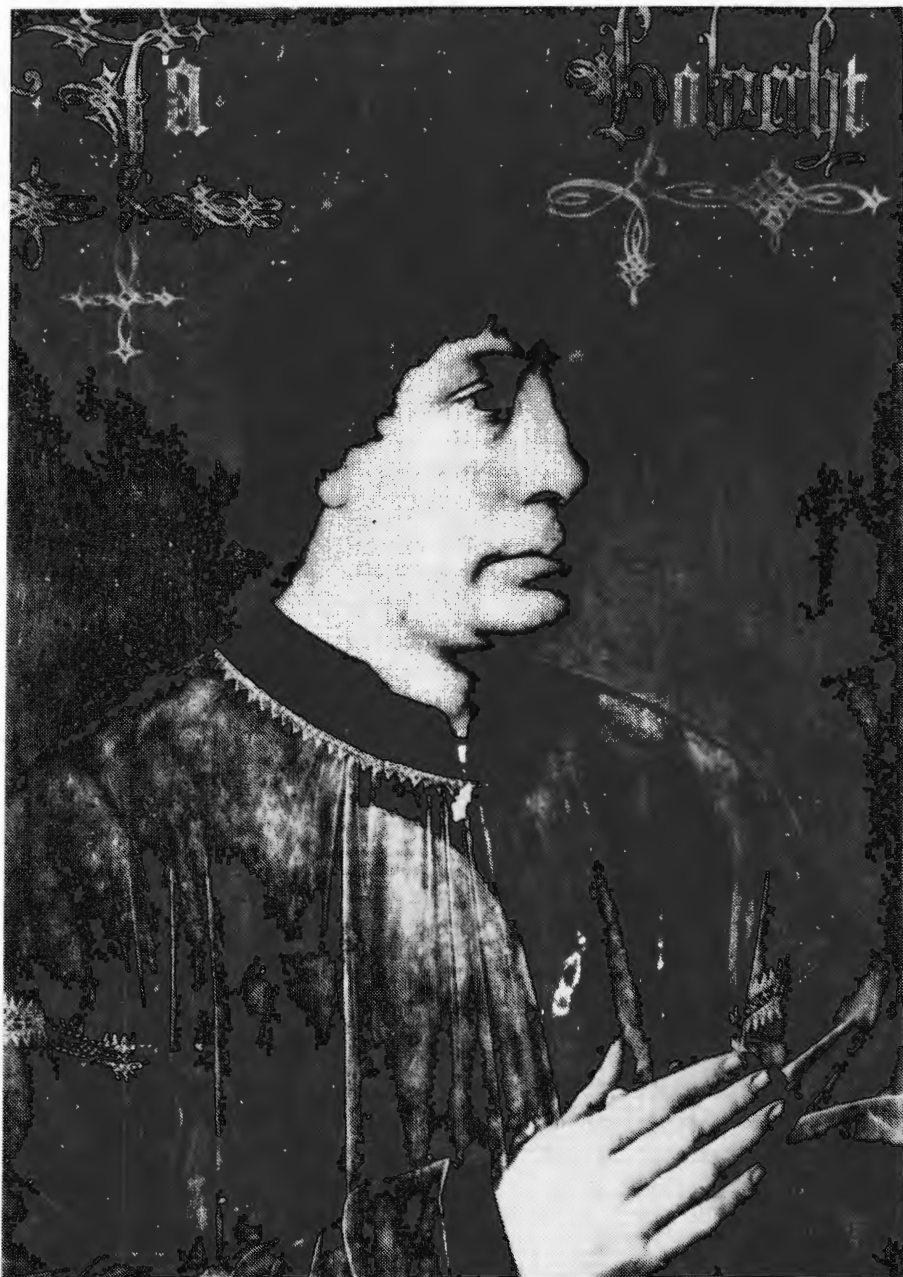
1. Jacob Obrecht in 1496