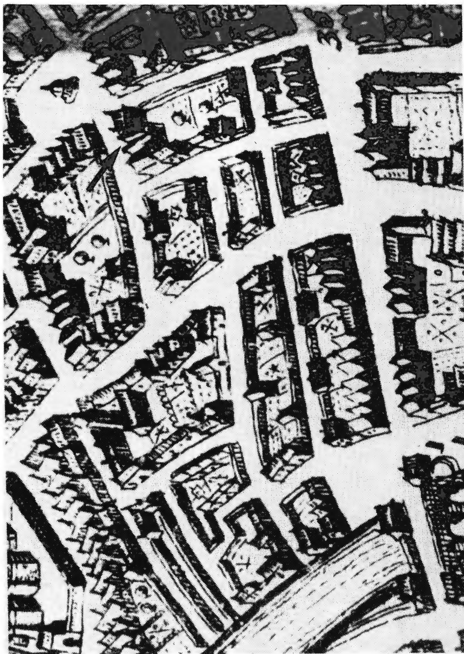
4. Ligging van het huis dat Obrecht aankocht in 1492