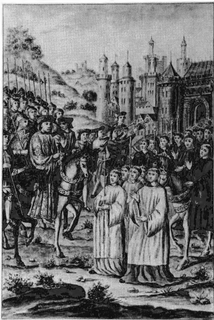
Entrée de Philippe le Bon à Gand en 1458.