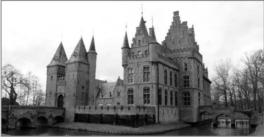
Afbeelding 1. Het huidige kasteel van Lovendegem, met middeleeuwse onderbouw.

toekomstige heren en dames van Lovendegem en Zomergem, veilig te stellen. 8