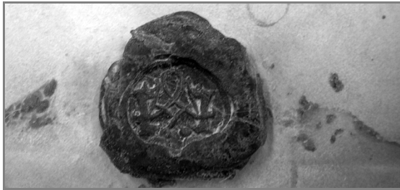
Afbeelding 3; Het privé-signet van de hertog met de gespiegelde “E” als personificatie van de hertogelijke politiek tussen 1457 en 1465 (RAB, Oorkonden met Blauwe Nummers, n° 7513).