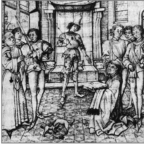
Afbeelding 4. De presentatieminiatuur uit het werk “ le débat de la noblesse ”. De oude adel (rechts, met korte kledij, onderling roddelend) en de nieuwe adel (de figuur links, met lange kledij) proberen de gunsten van de hertog (midden) te verkrijgen, gesymboliseerd door de om één been vechtende honden onderaan. De nieuwbakken edelman – Coustain? – lijkt niet in de meest gunstige positie te staan, bedreigd als hij wordt door de figuur met het getrokken justitiezwaard direct rechts van hem (KB Kopenhagen, ms. Thott 1090, fol. 67r o ).

beschouwd niet zozeer een breuk als wel een continuïteit te vormen met het verleden en met de omstandigheden die Coustains fortuin en blitzcarrière in eerste instantie mogelijk hadden gemaakt. 113 Wellicht betreft het gewoon twee symptomen van eenzelfde gegeven of ontwikkeling, namelijk die van de – ‘soevereine’ – vorstelijke macht. 114 Eerst had de hertogelijke procureur de vorstelijke hoog-