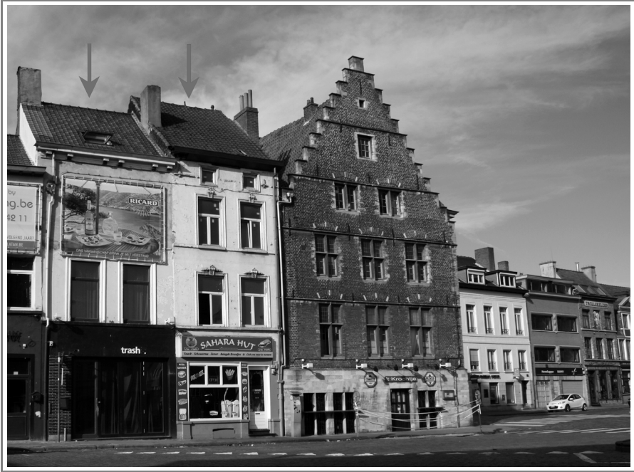
Afbeelding 3: Het neringhuis van de tapijtwevers bevond zich aan de Vlasmarkt (Stad Gent, Dienst Stadsarcheologie)

Het archief van de corporatie bleef in zekere mate bewaard, maar de oudere rekeningen ontbreken. Toen de bezittingen van de Gentse ambachten in 1540 werden aangeslagen, gingen veel documenten verloren. Gelukkig bleven de keure en het inschrijvingsboek van 1467 bewaard. Ze bieden een kijk op de organisatie van de corporatie en op de reglementering van de productie. 15 Uit onderzoek van Johan Dambruyne blijkt dat de nering van de tapijtmakers belangrijk bleef tot haar opheffing. 16 Op grond van haar materiële bezittingen bekleedde ze in 1540 de elfde plaats onder de Gentse gilden, maar merkwaardig genoeg was ze maar in het bezit van één wandtapijt.