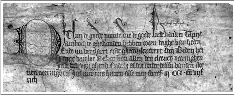
Afbeelding 2: De aanhef van de keure van 1350

heeren ende andren notabele ryke persoenen ende coepmannen gherne souden doen wercken binnen deser stede, die dit voorseide let nie anverden en meughen bij ghebrenken aen cnapen'. 13 Vraag is natuurlijk of die overmaat aan bestellingen met de realiteit overeenstemde. Het kan ook een noodkreet zijn geweest van neringmeesters die vreesden de boot te missen in de concurrentiestrijd met de andere productiecentra die minder strakke arbeidsregels hanteerden. Zoals eerder vermeld, waren er in Gent immers maar vier getouwen en vier wevers toegelaten per atelier.