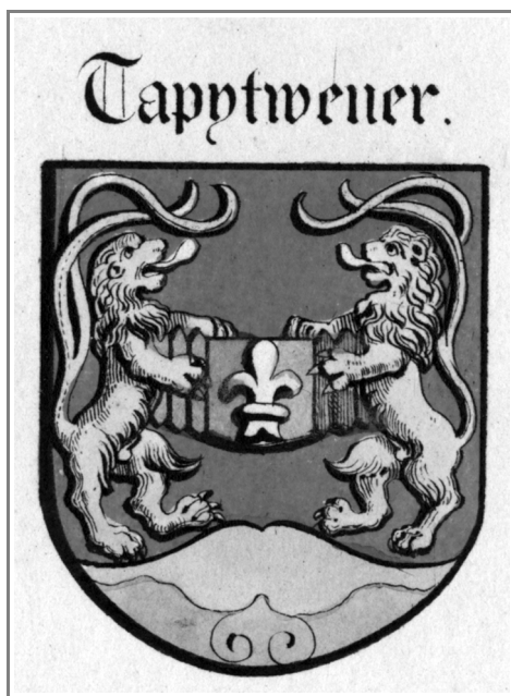
Afbeelding 1: Het wapenschild van de tapijtweevers (F. De Vigne, Recherches historiques , pl. 10 / Stad Gent , Dienst Stadsarchief).

ken, mag het aantal productieplaatsen in de vermelde jaren respectievelijk worden geschat op 15, 35 en 45. Het aantal professionelen die producten voortbrachten welke in onze huidige visie als wandtapijten worden beschouwd, moet echter worden gerelativeerd. Het woord tapijtwerk dekte in Gent immers zeer verscheidene begrippen. De saergemakers , bekend als de oudste leden van het ambacht, weefden bedspreien, ameublementstoffen of wandtapijten met figuratieve voorstellingen. De dobbelwerkers stonden in voor een niet nader gedefinieerd product, misschien een soort double-face . Wij beperken ons hier tot de legwerkers die eigenlijke wandtapijten vervaardigden.