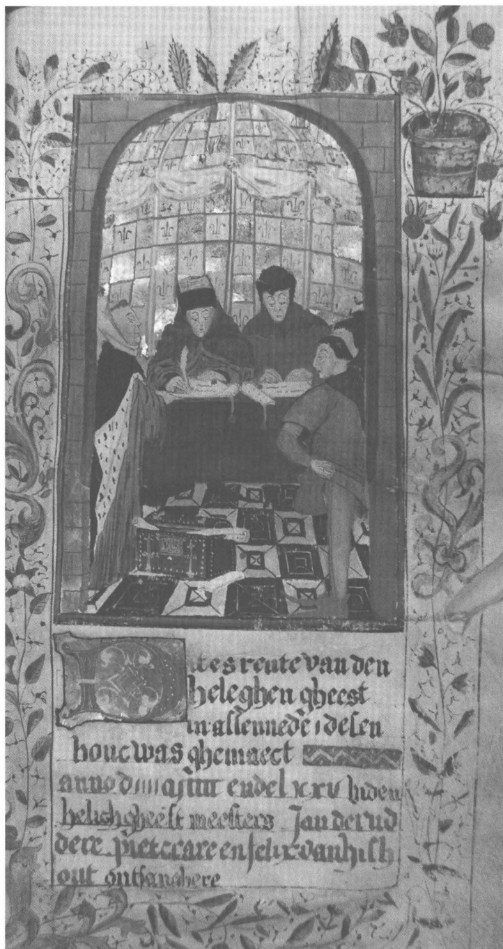
Afb. 6: Een renteboek van de armendis van Assende, 1475 (RAG, Kerkarchief Assenede, nr. 113bis)