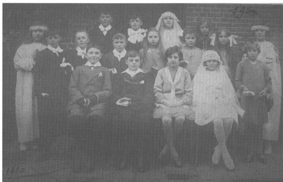
Afb. 2: De communicanten van Melsen in het jaar 1930 (RAG, Kerkarchief Melsen, nr. 354)