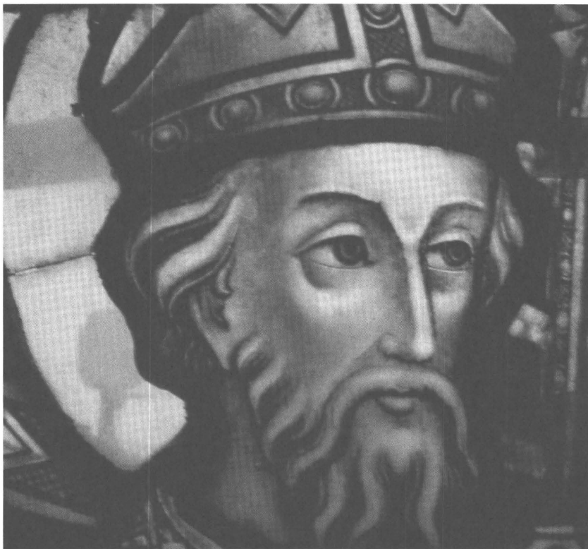
Afb. 1: Een glasraam uit het restauratiedossier van de kerk van Schelderode, 2005 (RAG, Kerkarchief Schelderode, nr. 51)

De hiernavolgende afbeeldingen zijn een willekeurige selectie uit de rijkdom van de Oost-Vlaamse kerkarchieven; ze tonen aan dat de lokale kerkarchieven een nieuwe en verscheiden kijk op het sociale, culturele en parochiale leven uit het verleden toelaten.