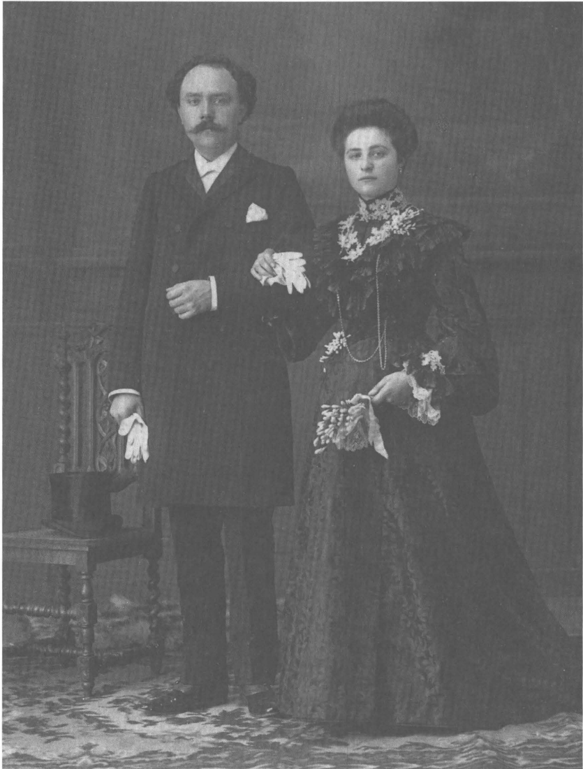
Afb. 2: Trouwportret