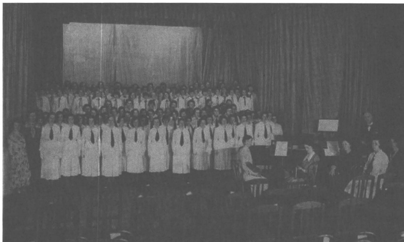
Afb. 8: het jubileumcantate te Eeklo, in aanwezigheid van de organist en het koor.