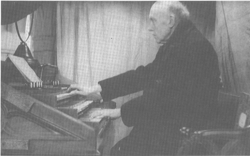
Afb. 6: de organist op leeftijd aan het Cavaillé-Coll orgel.