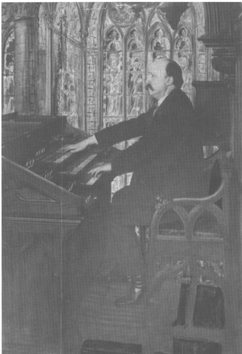
Afb. 5: de jonge organist aan het Cavaillé-Coll orgel in de Gentse Sint-Niklaaskerk.