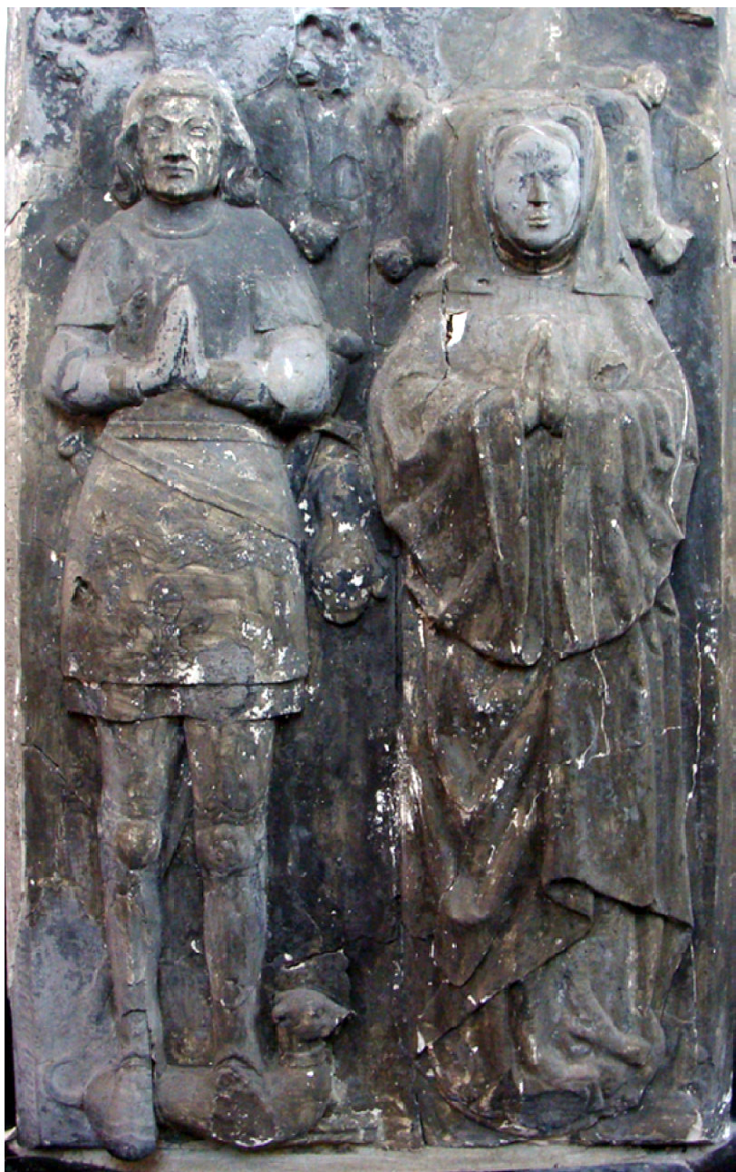
Afbeelding 1: Graf van Jeronimus Lauwerein in de Onze-Lieve-Vrouw-Hemelvaartkerk te Waterloet.