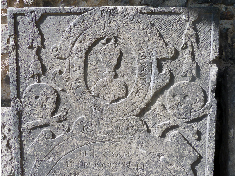
Afbeelding 2: Bovenste deel van de grafsteen van kapelaan-majoor Franco Henriquez (+ 1625), een van de weinige grafstenen afkomstig uit het Spaans Kasteel die ter plaatse bewaard bleef. In het veld is een kelk afgebeeld waarboven de gekroonde letter A en doodshoofden op de zijkanten.

pen die in het openbaar ontucht bedrijven, niet bij de eigen pastoor berust, maar bij de kerkelijke rechtbank. 38