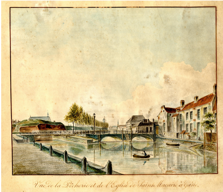
Afbeelding 4: Prent van de Pasbrug met links het Spanjaardenkasteel door Joseph Wynants, begin negentiende eeuw (Stad Gent: De Zwarte Doos-Dienst Stadsarchief, AG W4; fotografie Storm Calle)

muleren we eveneens een antwoord op de vragen die we in de inleiding hebben gesteld.