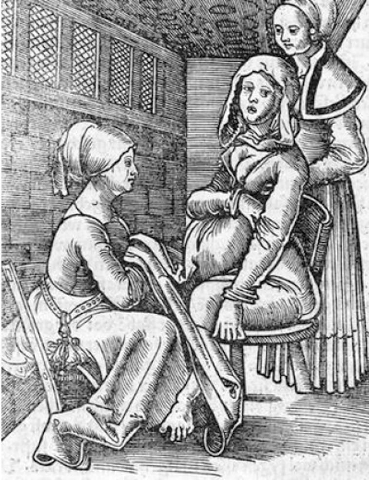
Afbeelding 2: Twee vroedvrouwen begeleiden een bevalling (Uit een 16e-eeuws boek van Eucharius Roeslin, 1526). In de 18de eeuw was de situatie nauwelijks gewijzigd.

sche aspecten van het ouderlijk gezin, het eigen gezin en aspecten van migratie en mortaliteit van de vroedvrouwen uitgelicht.