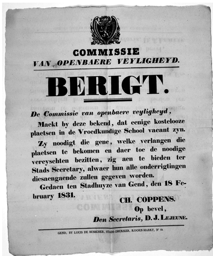
Afbeelding 4: Affiche van de 'Commissie van Openbaere veyligheyd' van Gent uit 1831 waarin ze een vacature voor vroedvrouwen in de Vroedkundige School bekend maakt.

lage levensverwachting betekent niet dat deze leeftijd niet of nauwelijks werd overschreden. Wel sloeg de dood harder toe: op alle leeftijden stierven meer mensen. Onevenredig veel mogelijke levensjaren gingen verloren door de hoge zuigelingen- en kindersterfte. 74