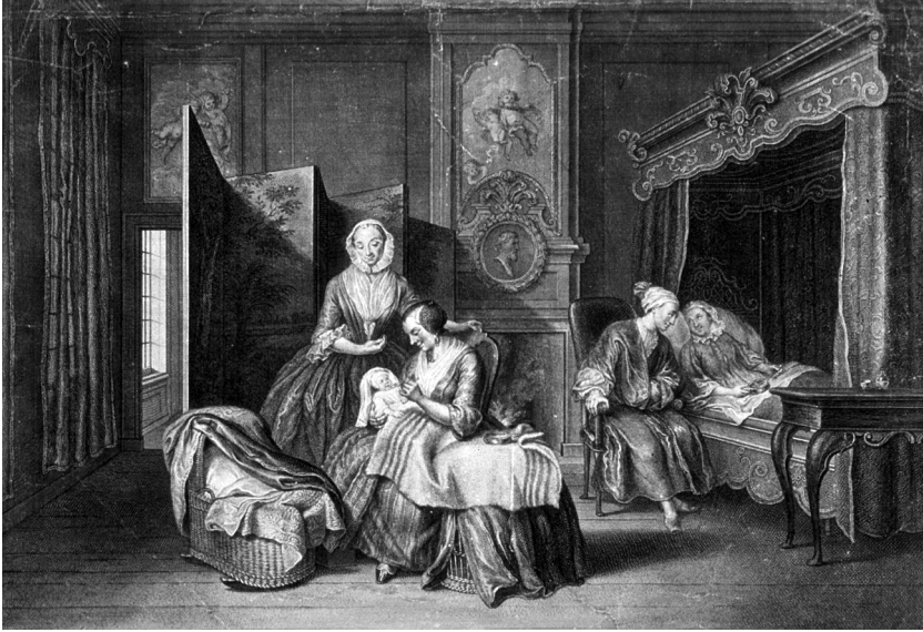
Afbeelding 1: 'De Hollandsche Kraam Kamer' door Troost, Cornelis, 1697-1750. De baringstijd van een vrouw was een speciale tijd die ze deelde met andere vrouwen: de vroedvrouw en vriendinnen. Mannen werden angstvallig geweerd. In de loop van de Vroegmoderne Tijd kwam hier verandering in en kregen mannen geleidelijk ook toegang tot de kraamkamer én de verloskunde.

aan degelijk geschoold medisch personeel. 15 Vanuit populationistische bekommernissen, beschouwde men het opleiden van vroedvrouwen en bijgevolg de oprichting van vroedvrouwscholen, als noodzakelijk. 16 In 1775 werd een eerste vroedvrouwencursus ingericht te Gent. Dit resulteerde in 1778 in de oprichting van een officiële vroedvrouwenschool 'École royale et supérieure d'Accouchements'. 17