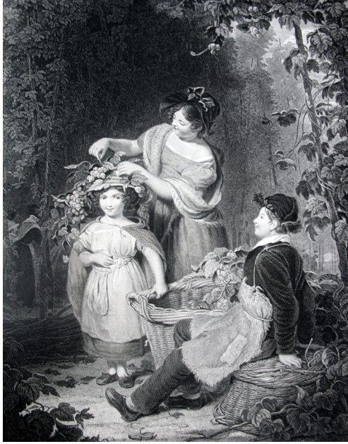
19 de -eeuwse gravure 'The Crown of Hops' (privéverzameling auteur)

eeuwse reglementen van Poperinge en Aalst halen dan ook uitdrukkelijk fraude aan als reden voor de opmaak van hun reglementering.