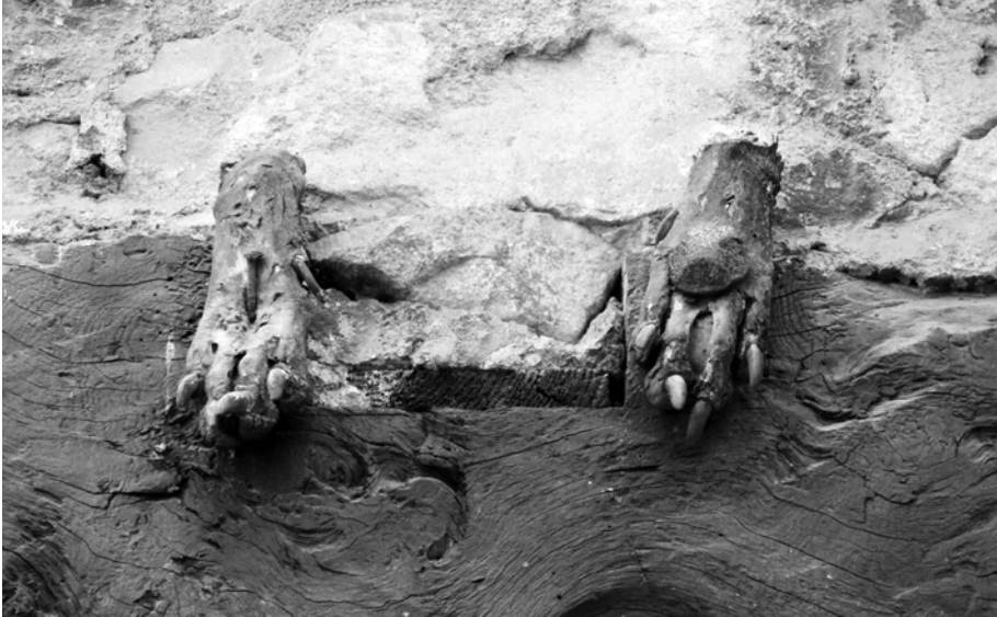
Afbeelding 5: Wolfenpotten gespijkerd boven de deur van een woning in Charnay, regio Rhône-Alpes, Frankrijk.

nay (departement Rhône, regio Rhône-Alpes) (afb. 5). Vermits de wolf rond 1900 uit de regio moet verdwenen zijn 52 , hangen de trofeeën er al minstens een eeuw, een gegeven om in rekening te brengen bij de interpretatie van het Gentse stuk.