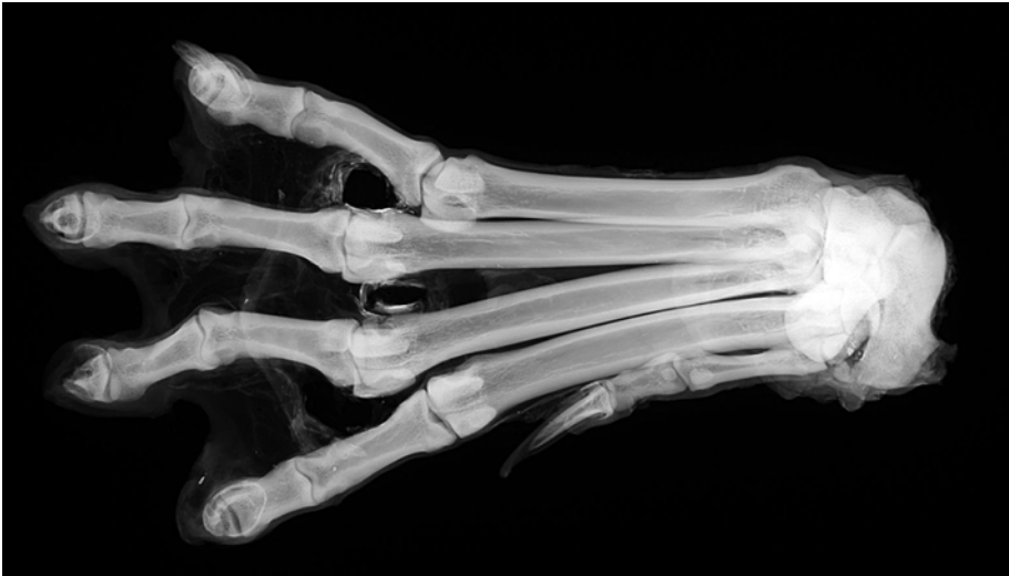
Afbeelding 3: Digitale röntgenopname van de gemummificeerde poot.

geval lijkt er een duidelijke afstand te bestaan tussen de oorspronkelijke herkomst van de dierenpoot en zijn opduiken in de nalatenschap van Versturme, en de beschrijving in de catalogi van het Gentse museum. Dit alles maakte het natuurlijk noodzakelijk binnen deze studie een hernieuwde soortidentificatie uit te voeren.