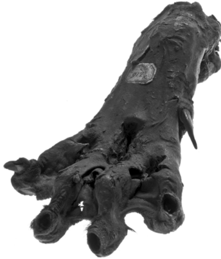
Afbeelding 1: Een gemummificeerde dierenpoot: inventarisnummer 14.396 uit het Gentse STAM.

rend uit 1878 2 , onder datzelfde nummer een voorwerp beschreven wordt als “ Patte de Léopard qui se trouvait attachée à la porte d’entrée du château de Comtes de Flandre, à Gand ”. 3