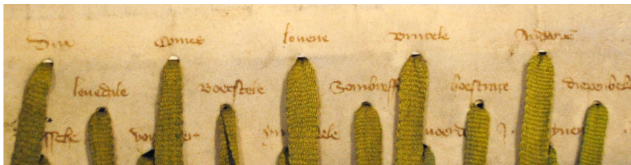
Afbeelding 3: Gents exemplaar van het Brabants-Vlaamse verdrag (Stad Gent, De Zwarte Doos, Stadsarchief, SAG_OA_94_395)

de graaf niet in Gent was toen het verdrag opgemaakt werd. In dat geval hoopten de verbondenen misschien om het verdrag in de afwezigheid van de graaf te bekrachtigen, om hem daarna te dwingen om het te bezegelen. Vandaar dat ze al een zegelstaart hingen op de plaats waar de graaf later zijn zegel moest hangen.