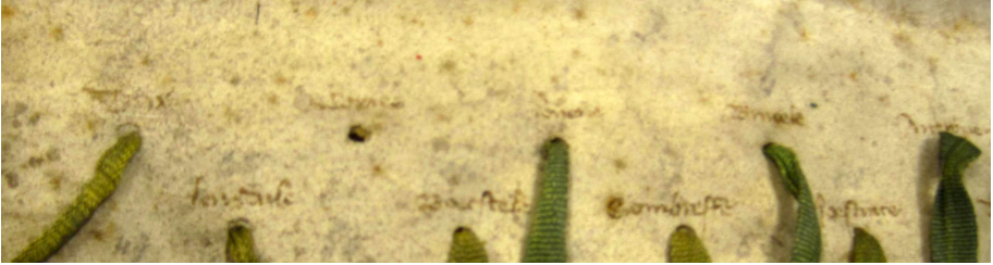
Afbeelding 1: Brussels exemplaar van het Brabants-Vlaamse verbond (Algemeen Rijksarchief Brussel, Charters van Brabant, nr 621bis)

Antwerpse exemplaar heb ik niet kunnen controleren, omdat de plica omgenaaid is.