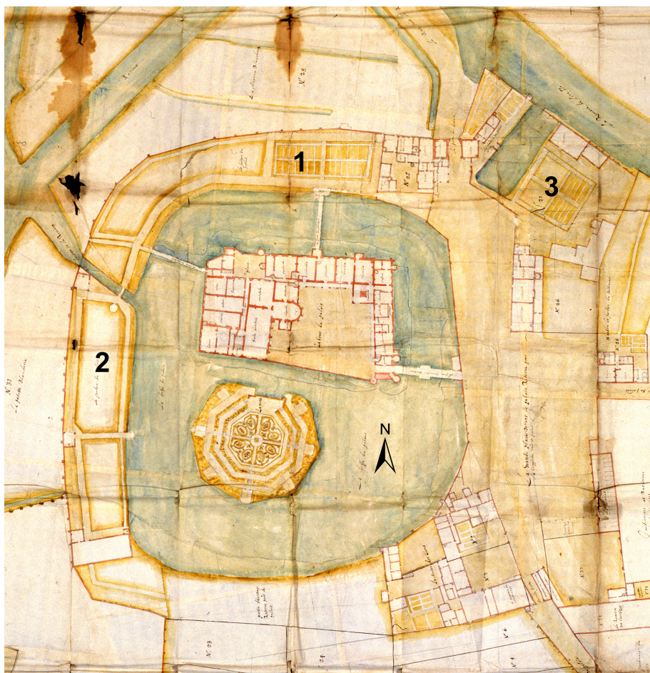
Afbeelding 3: Tuinen in het Hof ten Walle: 1. Tuin van de hertogin; – 2. Tuin van de hertog; – 3. Tuin van Maria van Bourgondië (Lille, Archives départementales du Nord, reeks E, nr. 2353, P.C. Mercx, Plan de la Cour des Princes à Gand, 1649)

loodsje. 65 Men trok ook een huisje op voor pauwen en voor een zwaan, en bezorgde een ketting met een hangslot waarmee een beer werd vastgeklonken. 66 Bekend is dat in de tuin van het Hof ook leeuwen huisden, die in 1473 er een jonge leeuwin bijkregen – de rekeningen vermelden niet of het een geboorte of een aankoop betreft; enkel dat hun hok hersteld werd voor de uitbreiding van de