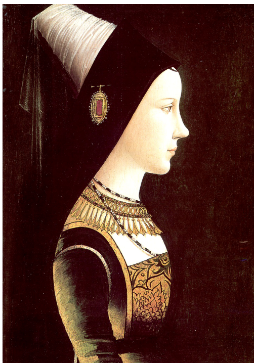
Afbeelding 1: Maria van Bourgondië (door Michael Pacher, Heinz Kisters Collection, Kreuzlingen)