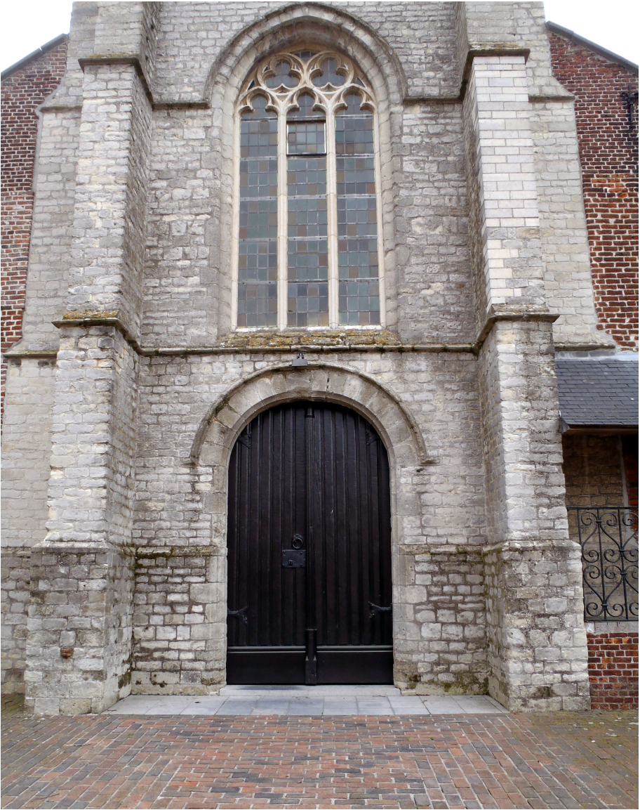
Afbeelding 1: Westtoren en kerkportaal van Elversele, daterend uit de 15 de eeuw. Op 3 september 1558 spijkerde Gillis Verdickt hier op de kerkdeur een pamflet tegen de geloofsvervolger Pieter Titelmans, hetgeen drieënhalf maanden later leidde tot zijn terechtstelling als ketter op de brandstapel in Brussel. Een gedenkplaatje wordt eerlang aangebracht. Het interieur van de kerk werd in 1578 van alle ornamenten ontdaan om ze om te vormen tot protestantse preekkerk, hoewel er niets bekend is over een eventuele predikant in Elversele. In 1583 begon men met de katholieke herinrichting, die pas in 1627 volledig voltooid was