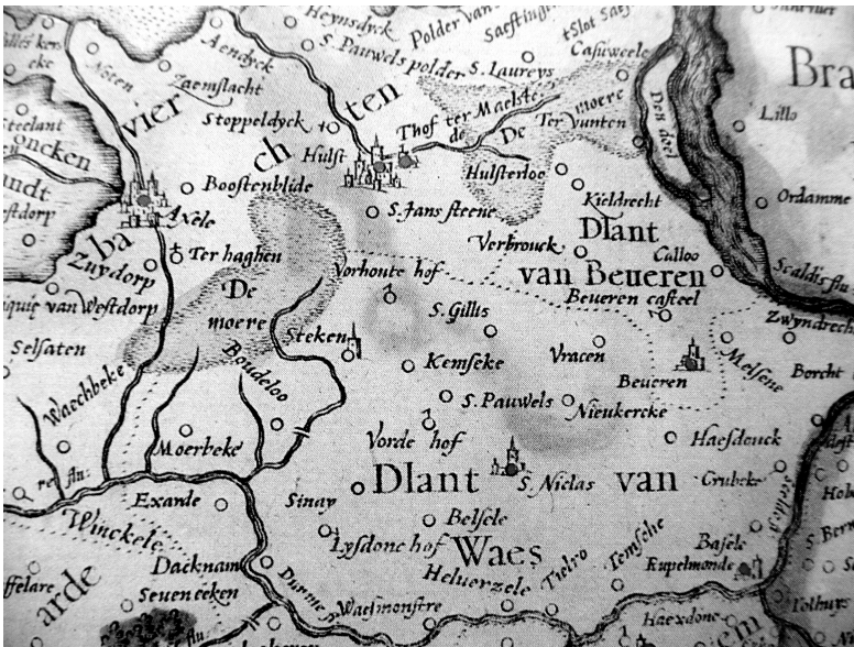
Afbeelding 2: Het Land van Waas. Detail uit de kaart van Mercator in de Mercator-Hondius Atlas van 1613

Tegen het eind van 1578 waren er in de stad Gent en elders in Vlaanderen evenveel predikanten actief als in alle andere Nederlandse gewesten samen. Ook in het Land van Waas kwam de calvinistische kerkorganisatie nu langzaam op gang. Naast gedrevenheid om de nieuwe leer overal ingang te doen vinden, speelde tevens mee dat men de plattelandsbevolking niet blijvend van godsdienst oefening verstoken wenste te laten. De pastoor van Haasdonk rapporteerde in mei 1579 immers dat bijna alle parochiepriesters van zijn streek verdreven of gevlucht waren. 39 Zeldzaam waren de afgezette pastoors die ingingen op het aanbod van de schepenen van Gent om alsnog in het land te blijven en ter compensatie van hun nu gederfde inkomsten een onderhoudsgeld te ontvangen. Zulke “alimentatie” vonden we in Waas enkel voor Pieter Tack, eertyts pasteur gheweest van der prochie van St Pauwels int Landt van Waes . 40