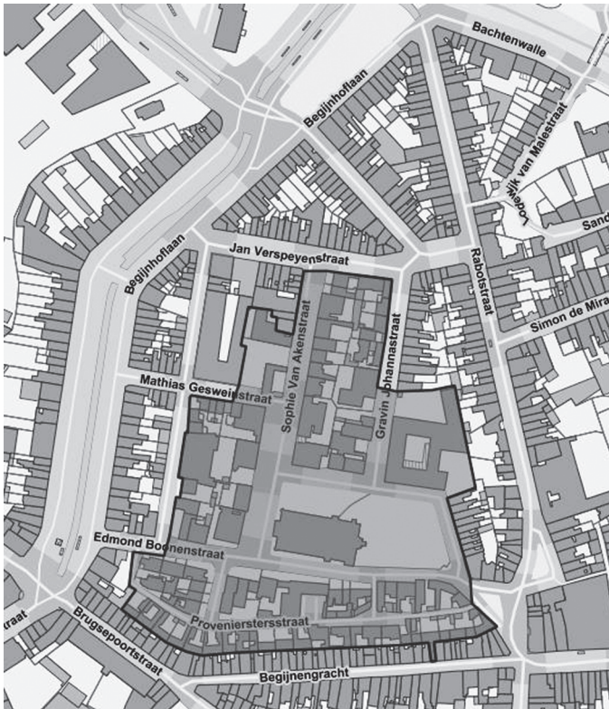
Afbeelding 2. Hedendaags situeringsplan van het Sint-Elisabethbegijnhof, met aanduiding van het beschermde stadsgezicht (Sint-Elisabethbegijnhof [online] <geo.onroerendergoed.be> (geraadpleegd op 8 januari 2017))

Provenierstersstraat, Edmond Boonenstraat, Begijnhofdries, Hippoliet Lammenstraat, Sophie Van Akenstraat, Gravin Johannastraat en Matthias Gesweinstraat vormen samen het historische stratenpatroon van het hof, al zij het soms in licht aangepaste vorm. Er zijn ook enkele duidelijke verschillen merkbaar. Zo is het begijnhof volledig opgenomen in het stedelijke weefsel, waarbij nieuwe verkavelingen het hof volledig hebben ingesloten. De verkaveling van de voormalige bleekweiden via de Jan Verspeyenstraat en de Hector Van Wittenberghestraat waren een eerste stap in deze richting (cf. infra). Het opvallendste verschil is de aanleg van twee grote verkeersassen aan weerszijden van het hof, met name de Begijnhoflaan ten (noord)westen en de Rabotstraat ten oosten die respectievelijk op het tracé van de stadsomwalling en van de oostelijke gracht werden aangelegd. Dit is niet af te leiden uit het plan van 1792 maar ook de bebouwingsdichtheid ligt veel hoger, voornamelijk in de westelijke en oostelijke bouwblokken.