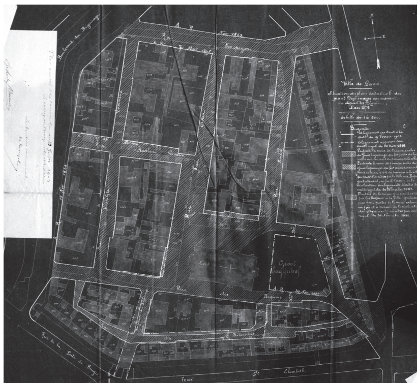
Afbeelding 5. Rooilijnplan voor het Sint-Elisabethbegijnhof, goedgekeurd door K.B. van 30 november 1881, weergegeven op een kadastraal plan van 1872 (Archief OCMW Gent, Commissie der Burgerlijke Godshuizen, BG 11 Begijnhoven, nr. 63)

de sloop van de toegangspoort en de zes aanpalende begijnenhuizen werd een klein plein gecreëerd, het huidige Sint-Elisabethplein, waarvan de aangrenzende percelen ten noorden in 1882 werden verkocht en nadien bebouwd met acht nieuwe woningen. 68 De nabijgelegen Ecce Homokapel moest, vermoedelijk omwille van een vlotte verkeersdoorstroming, wijken en zou in 1883 worden verplaatst van de zuidwestelijke hoek van de dries en tegen het koor van de begijnhofkerk worden aangebouwd. In 1882 werd ook de hoek van de Begijnhoflaan en de Brugsepoortstraat vormgegeven en verkaveld in zes loten. 69 Na de heraanleg van de Gravin Johannastraat zou men tenslotte tussen 1883 en 1884 alle oorspronkelijke begijnenhuizen in het oostelijke deel van deze straat vervangen door eigentijdse rijhuizen (cf. supra).