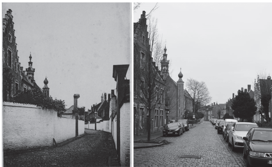
Afbeelding 4. Zicht op de Edmond Boonenstraat vanaf het westen, vóór de afbraak van de tuinmuren in 1876 (links) en de actuele situatie (rechts), (Stadsarchief Gent, MA_SCMS_FO_0272, Sint-Elisabethbegijnhof, Edmond Boonenstraat (links) & Foto Daan Declercq, 8 januari 2017 (rechts))

schieten waarvan ze nadien de helft konden terugvorderen van de stad (renteloos en gespreid over een periode van tien jaar). 62