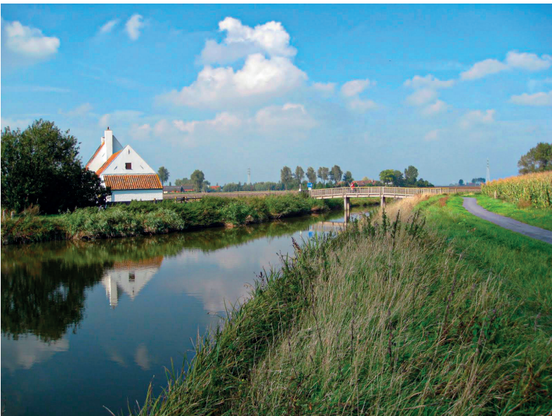
Afb. 5. De Proosdijkvaart in Boitschoeke.