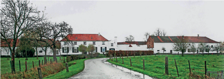
Afb. 4. Van de proosdijgebouwen van de abdij van Ninove in Dikkelvenne resten nog de hoevegebouwen.