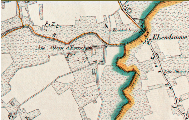
Afb. 2. De hoeve van de abdijs van Eversham (Stavele) in een bocht van de IJzer (boven) en de Poperingevaart (rechts). Ph. Vandermaelen.