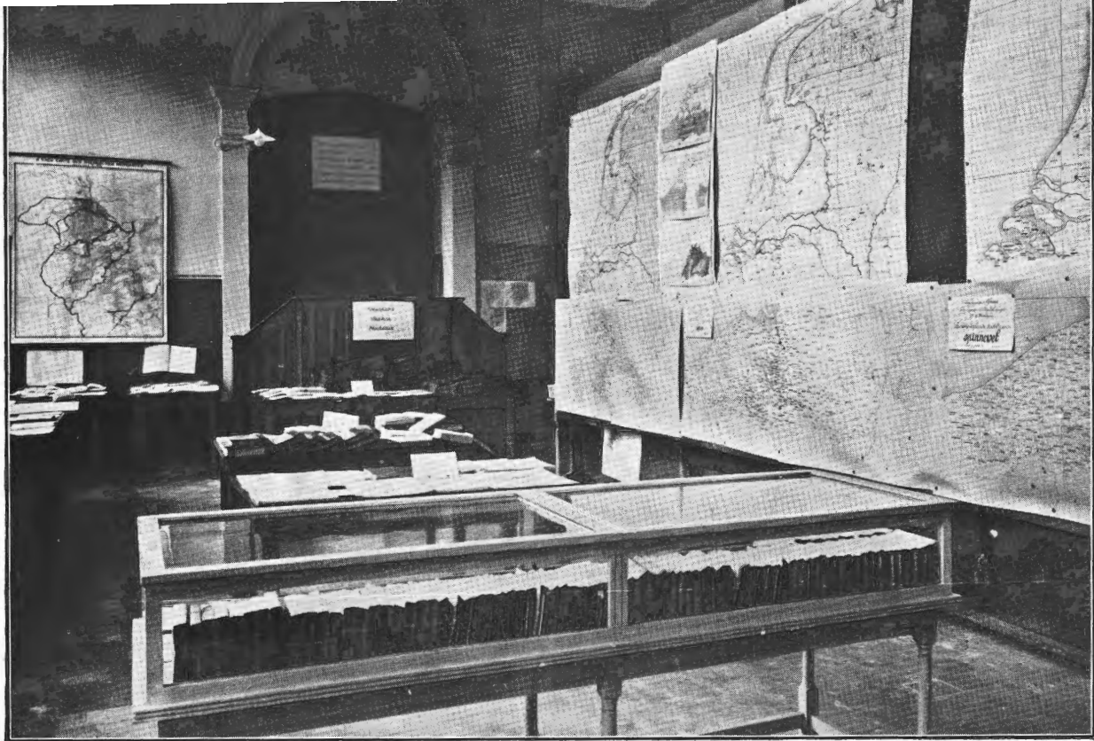
Tentoonstelling v. Nederlandse Dialektologie. Gent 1, 2, 3 April 1932.