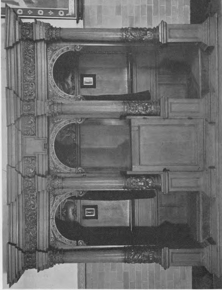
Biechtstoel van Rycquaert Brouckman (1663) in de S. Pietersbandenkerk te Oostkamp