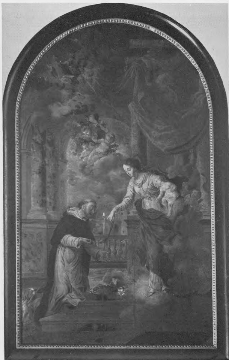
II. — O. L. Vrouw van de Rozenkrans door J. A. Garemijn (1785) in de S. Pietersbandenkerk te Oostkamp