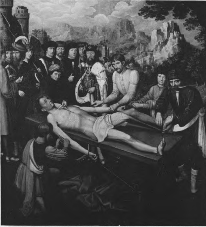
De terechtstelling van Sisamnes