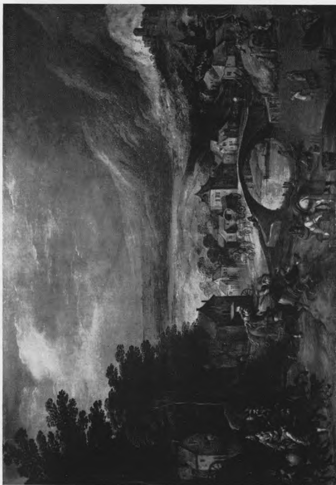
Landschap met de brug