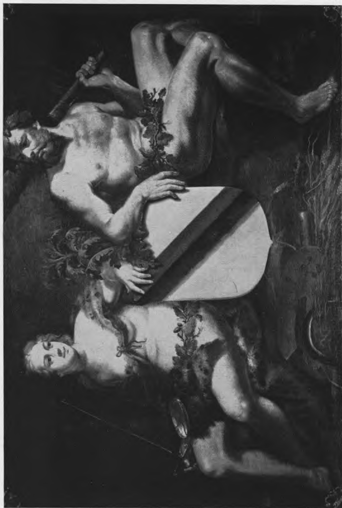
Allegorie „Het Brugsche Vrije”