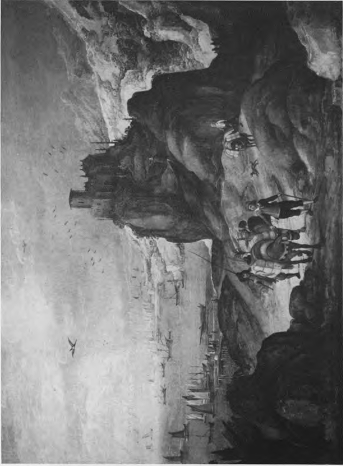
Landschap met de ezeldrijver