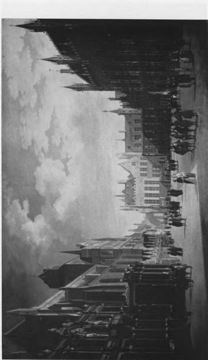
De Burg te Brugge