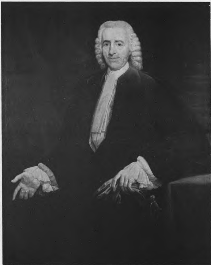
Leopold de Tollenaere