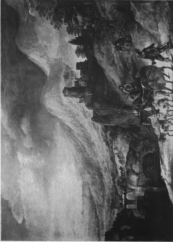
Landschap met soldaten