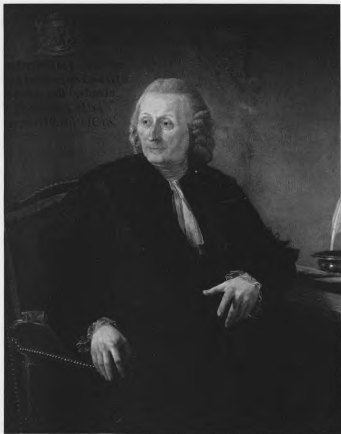
Carolus de Gheldere