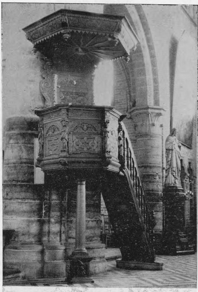
Predikstoel in de kerk te Lissewege