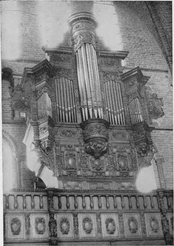
Orgel in de kerk te Lissewege