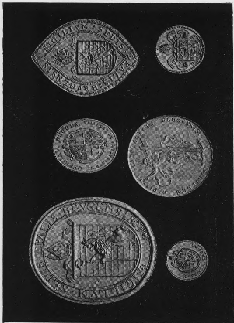
Boven : I. Groot Bisdomezegel, II. Groot zegel van de Officialiteit, III. Minder Bisdomezegel Onder : I. Klein zegel van de Officialiteit, II. Kapittelzegel (± 1834), III. Klein Bisdomezegel